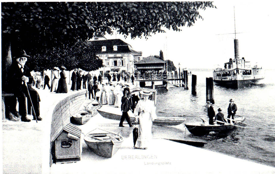
Ansichtskarte um 1900. Kreisarchiv Bodenseekreis.

J. C. HEER: Freiluft. Konstanz o. J. (ca. 1905), S. 134–136.