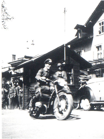
Unmittelbar vor dem Einmarsch der Franzosen versucht ein SS-Offizier auf dem Motorrad zu flüchten. Am Grenzzaun zwischen Kreuzlingen und Konstanz wird er kurz darauf von einem oft schikanierten Untergebenen erschossen.