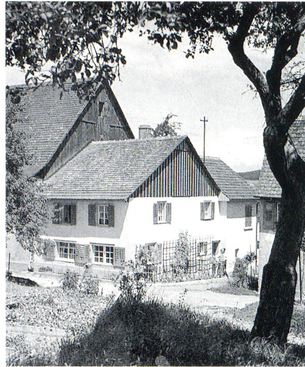
Wohnhaus Dittrich um 1939.

Für den Augenblick hat auch unsere Kartoffelnot ein Ende. Habe selbst einige grosse neue geerntet, dazu gab es heute eigene Erbsen und gelbe Rüben ... Der Weinberg ist fein in Ordnung, sauber gehackt und aufgebunden. Das mache ich ja nun alles selbst, und es hat viel Trauben wie noch