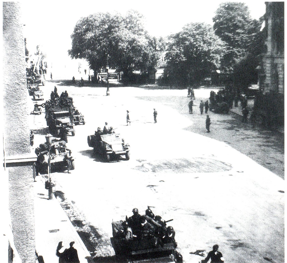
Französische politische Häftlinge aus Dachau bedanken sich bei der Schweiz und dem Roten Kreuz.

Die spielerische Vermittlung des Verbots, sogenannte «Feindsender» zu hören, im Bodenseeraum vor allem Beromünster.