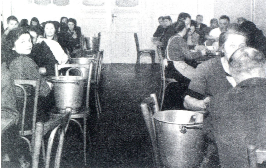
Rückwanderer-Kinder im Hotel «Schiff» 1945.