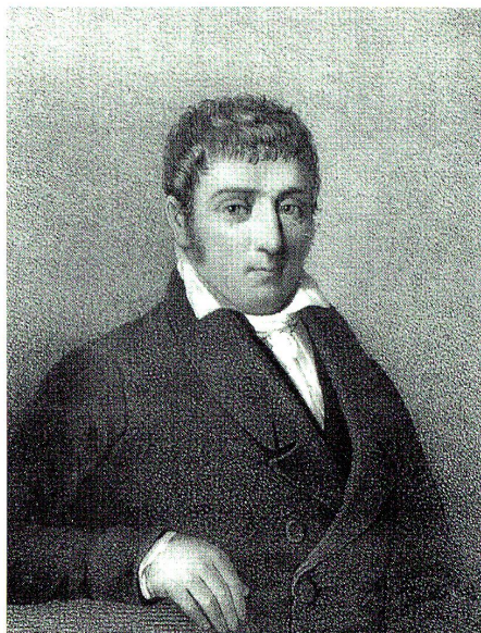
Ludwig Zeerleder, bernischer Gesandter auf dem Wiener Kongress, in: (Zeerleder Bernhard) Erinnerung an Ludwig Zeerleder (Konstanz 1843)

eine weitere Aufgabe übernahm, nämlich die wichtigste und am meisten bedrohte Grenze (hier hatten die französischen Revolutionsarmeen zuerst schweizerisches Territorium besetzt) zu sichern. Der nördliche Teil des Juras war schon früher ein wichtiger Eckpfeiler des «Vormauernsystems» 9a gewesen, seine Sicherheit schien Metternich am besten durch Bern gewährleistet. Aus äusseren und inneren Gründen war die Zeit für einen eigenen Kanton Jura noch nicht reif, es gab damals gar keine andere Wahl.