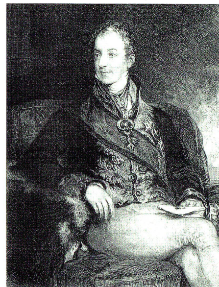
Fürst Metternich, Stich nach dem Gemälde von Th. Lawrence, in: Menschen, die Geschichte machten, Bd. 2 (Wien 1934)

Nachdem sich Frankreich nach dem Sturz Napoleons sehr rasch erholt hatte, kehrte es zur traditionellen Politik der Einflussnahme auf die Schweiz zurück. Der Brückenkopf, dessen es bedurfte, um das übermächtige Österreich auszubalancieren, sollte Bern sein, ein starkes, nach Westen hin vergrössertes Bern. In den Korrespondenzen des Genfers Pictet de Rochemont und des Franzosen Talleyrand – beides wichtige Diplomaten auf dem Wiener Kongress – finden wir Belegstellen. Am 14. Dezember 1814 schrieb Pictet de Rochemont an Turretini* in Genf: «Je reviens de chez Wrède** . Il m'a dit que la raison donnée par Dalberg*** pour ne pas attribuer Porrentruy à Genève 10 , mais bien à Berne, c'est qu'il fallait que Berne fût fort, pour mener le reste; que ce grand nombre de cantons ne convenait pas à la France, et que le mieux serait qu'il n'y en eût que deux!» 11 Dieselbe Ansicht über die Rolle Berns äusserte Talleyrand in einem Brief an den Aussenminister: «Que l'influence de