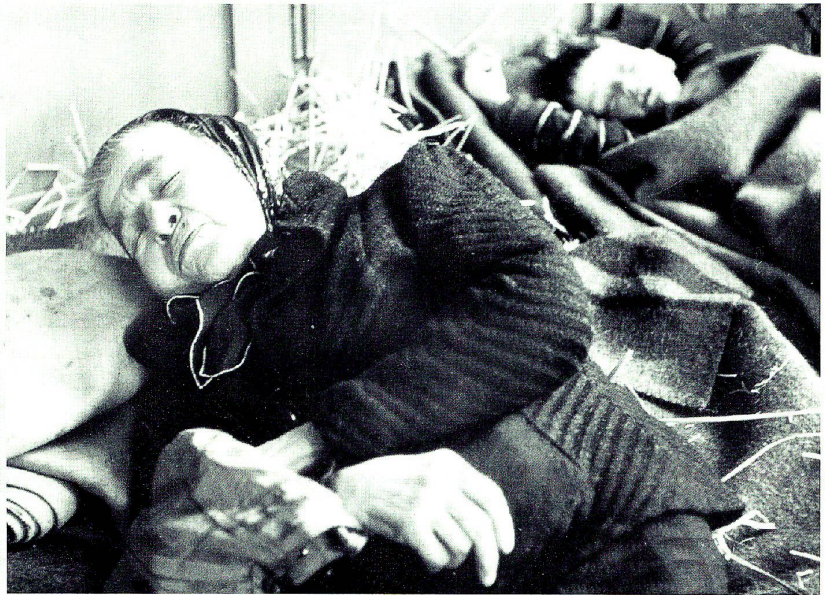
Jüdische Flüchtlinge aus Theresienstadt: Eine alte Frau und ein Knabe, die müde nach ihrer dreitägigen Reise nach ihrer Ankunft in St. Gallen sofort eingeschlafen sind.

Wir danken hier nochmals allen Schweizern für das, was sie für uns tun, für ihre Art zu handeln und zu geben, die so ist, wie es nur eine Nation kann, die Jahrhunderte selbst frei ist.