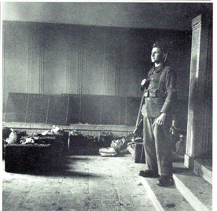
Hadwigschulhaus, Administration, Verpflegung, Wachtdienst, 1945