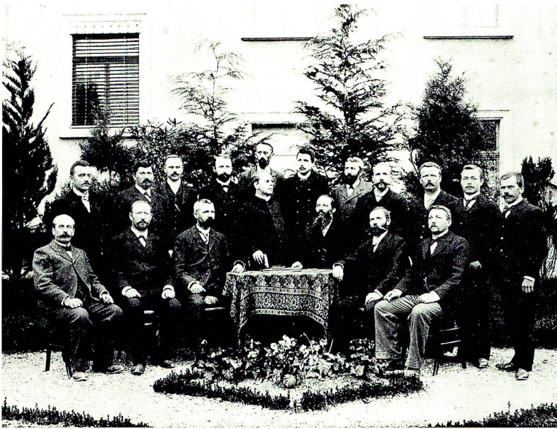
Die Lehrerschaft Liechtensteins im Jahre 1902