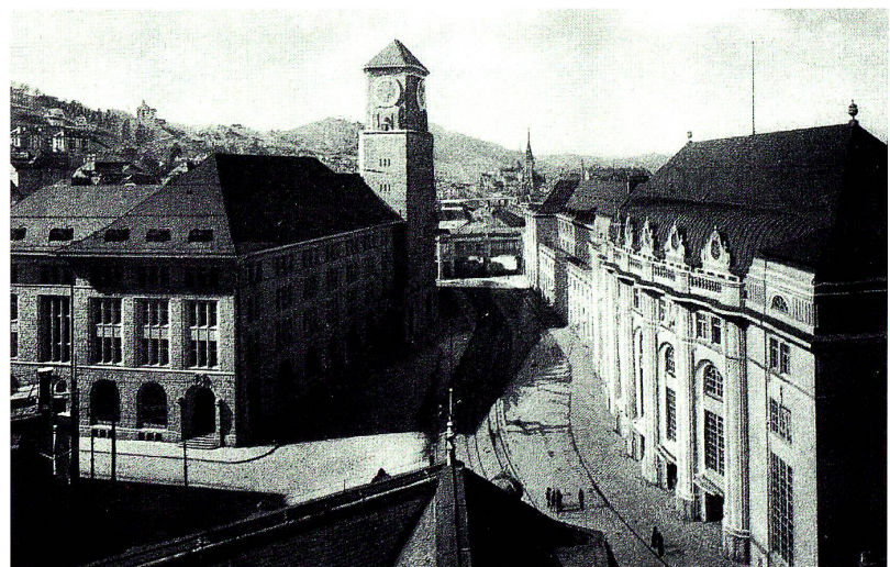
Bahnhofplatz in St.Gallen