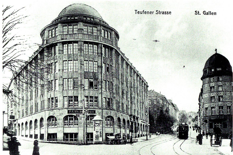
Blick in die Teufener Strasse um 1910