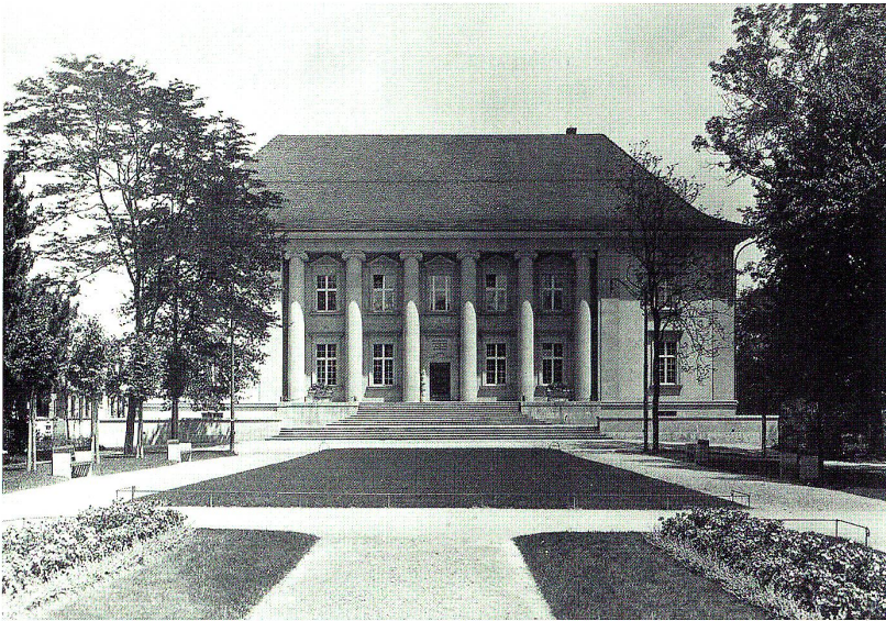
Ansicht des 1921 eröffneten Neuen Museums (Historisches Museum und Sammlung für Völkerkunde)

schule an der Notkerstrasse. Ein Jahr früher war ein Hallenschwimmbad eröffnet worden, es war das erste seiner Art in der Schweiz. Unmittelbar den Bedürfnissen des von St.Gallen ausgehenden weltumspannenden Handels entsprungen ist die 1898 vom Grossen Rat beschlossene Gründung einer Verkehrsschule sowie einer höheren Schule für Handel, Verkehr und Verwaltung. 1904 wurden die beiden Bildungsstätten getrennt; während die Verkehrsschule, die ihre Absolventen auf den Dienst bei Bahn, Post und Zoll vorbereitete, vom Kanton übernommen wurde, bildeten Stadt, Ortsbürgergemeinde und Kaufmännische Korporation fortan die Trägerschaft der Handelsakademie oder Handelshochschule, die 1911 einen eigenen Bau an der Notkerstrasse bezog. Später übersiedelte sie auf den Rosenberg und verwandelte sich vor wenigen Jahren in die Universität St.Gallen.