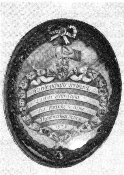
Schild des Handwerker-Gesellen-Vereins Chur 1820

ches Denken und Handeln die Gemeinschaft zusammenhielten und auch für deren schwächste Glieder sorgten, ergriffen in Chur die Handwerker-Gesellen die Initiative zu Selbsthilfe und Solidarität. Mehrheitlich bestand dieser Gesellenverein aus Handwerkern, teils aus der übrigen Schweiz, teils aus dem Ausland. Es war in der Zeit der Wandergesellen. Unter den Ausländern nahmen die Deutschen den ersten Platz ein. Sie gründeten 1841 in Chur den Deutschen Arbeiterbildungsverein.