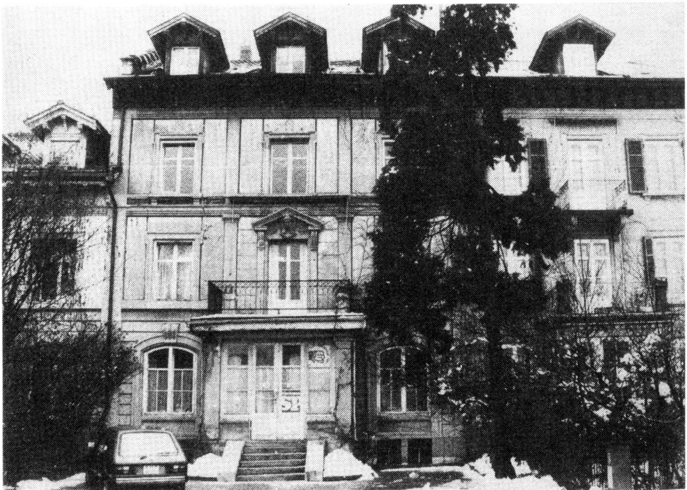
Die Südfassade der Liegenschaft Pavillonweg 3 (an der Stadtbachstrasse gegen die SBB-Geleise hin): Sandstein im Jugendstil, romantisch, aber da und dort bereits am Bröckeln. Sanierungsbedürftig sind in erster Linie Balkon, Fassade, Keller und Dach. Der Baum vor dem Haus weiss, was Waldsterben ist.

In ihr zweites Jahrhundert wird die SPS jedenfalls mit einem eigenen neu renovierten Parteihaus eintreten. RHS.