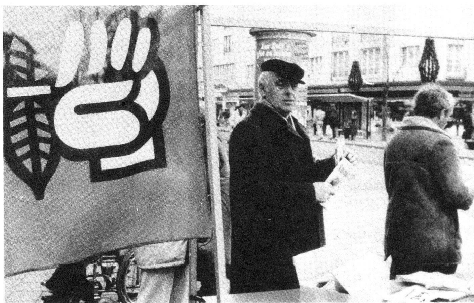
Helmut Hubacher vor den kantonalen Wahlen in Basel-Stadt im Jahr 1988

SPS-Präsident konnte von Beginn weg beweisen, dass es für ihn keine überkommenen Tabus in den Diskussionen um eine Neugestaltung der Politik gab. Eine Qualität, die er im Laufe seiner 15jährigen Amtszeit immer wieder und immer stärker unter Beweis stellen musste; denn es war die Zeitspanne, in der sich nicht nur die politische Landschaft (trotz relativ stabilem Parteigefüge), sondern ebenso die politische Arbeits- und Denkweise einer neuen Generation innerhalb der Partei wesentlich änderte. Nicht allein «institutionelle Krisen» wie die Fragen zur Regierungsbeteiligung und die Weiterexistenz der sich immer