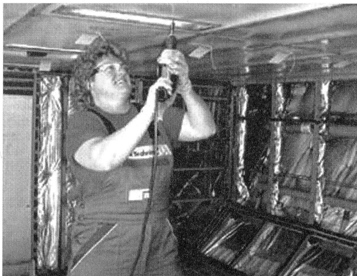
Flugzeugspenglerin bei der Arbeit

Zusammen mit der frühen Berufswahl führt dies die starke Segregation des Arbeitsmarktes in unserem Lande herbei. Offenbar waren/sind für junge Menschen «gegengeschlechtliche» Berufe keine Option!