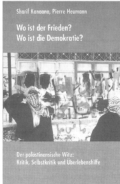
Wo ist der Frieden? Wo ist die Demokratie? Der palästinensische Witz: Kritik, Selbstkritik und Überlebenshilfe 159 S. Br. CHF 28 ISBN 3-0340-0536-9