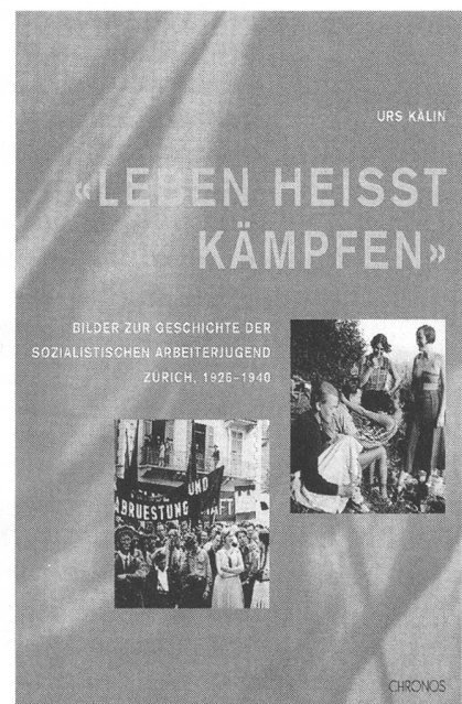
Leben heisst kämpfen Bilder zur Geschichte der sozialistischen Arbeiterjugend Zürich, 1926–1940. 176 S. durchgehend illustriert. Geb. CHF 48 ISBN 3-0340-0528-8