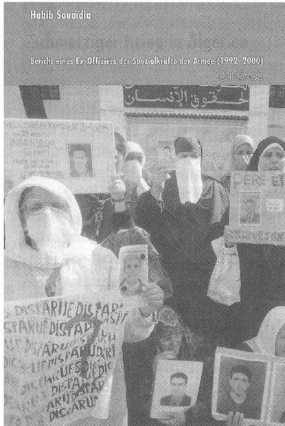
Schmutziger Krieg in Algerien Bericht eines Ex-Offiziers der Spezialkräfte der Armee (1992–2000) 205 S. Br. CHF 32 ISBN 3-0340-0537-7