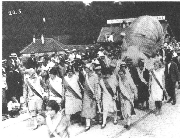
Die berühmteste Schnecke der Schweiz, die «Saffa Schnecke», illustrierte das Tempo, mit dem es in der Stimmrechts-Sache «vorwärts» ging.

Dachverband «Bund Schweizerischer Frauenvereine» im Berner Frauenrestaurant «Daheim», um die Anliegen der Schweizerfrauen gebündelt zu vertreten. Keine leichte Aufgabe, Politik zu treiben, ohne politische Rechte zu haben. Immerhin konnte man Petitionen schreiben. Im Archiv und in der Ausstellung ist das dicke Buch zu bestaunen, in dem die unablässigen Bittschriften an den «hohen Bundesrat» zusammengebunden sind.