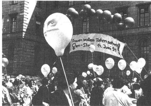
Als die Schweizerfrauen 1971 endlich das Stimmrecht bekamen, gab es noch immer viel zu tun. Die jungen Frauen machten mit Happenings oder – wie am 14. Juni 1991 – mit Streiks auf ihre Forderungen aufmerksam.

Der vorliegende Beitrag wurde für die Zeitschrift LIBERNENSIS 1/2002 der Stadt- und Universitätsbibliothek (vormals STUBS-nase) verfasst und dort erstmals publiziert.