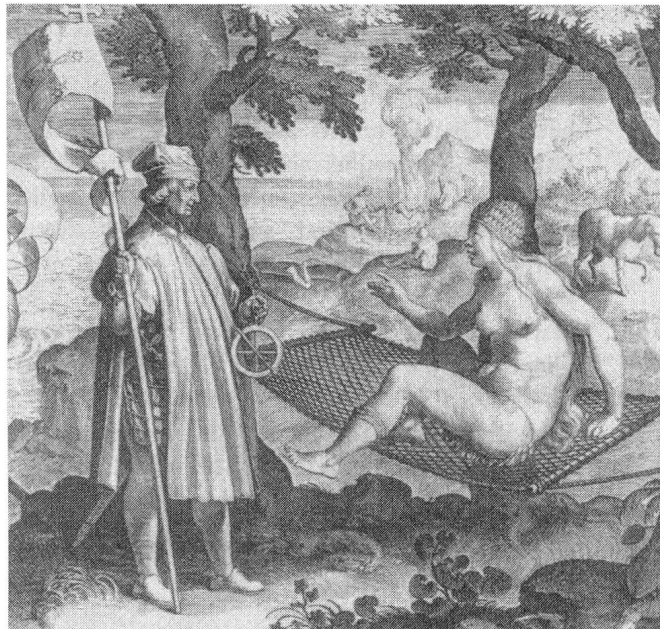
Jan van der Straet: Amerigo Vespucci trifft auf Amerika

eine geachtete Stellung innerhalb ihrer Gemeinde. 2 Die vorgefundenen Kulturen waren jedoch von Land zu Land sehr verschieden und so variierte auch die Entwicklung der sozialen Strukturen – und damit die Stellung der Frau – innerhalb einer Kolonie stark. Dabei spielten verschiedene Faktoren, welche den Verlauf einer solchen Entwicklung beeinflussten, eine wichtige Rolle: Erstens waren die Gesellschaftsordnungen – und mit ihnen die Arbeits-, bzw. Rollenverteilung zwischen Männern und Frauen – der indigenen Bevölkerung von Gebiet zu Gebiet verschieden. In gewissen Kulturen waren Frauen ebenso Jägerinnen wie die Männer.