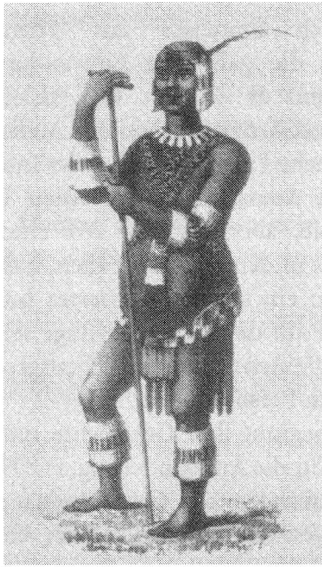
Feminisierung als Degradierung: Darstellung eines indigenen Mannes.

dass sie ebenso hart arbeitete wie die Männer, machte die indigene Frau in den Augen der Kolonisten zur «Unfrau» - ihr wurde jegliche Form von «Weiblichkeit», so wie die Kolonisten diesen Begriff füllten, abgesprochen. Den indigenen Männern hingegen, wurden weibliches Aussehen und feminine Verhaltensweisen angedichtet, um deren «Unterwürfigkeit» zu legitimieren. Rassistische Stigmata fanden ihren Weg auch wieder zurück nach Europa: Europäische Arbeiterinnen und Prostituierte wurden oft als «weisse Neger» bezeichnet. 6