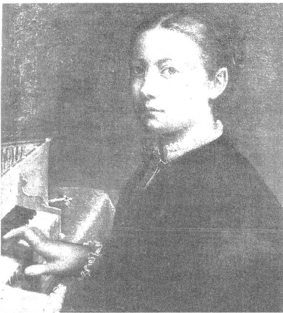
Sofonisba Anguissola, Selbst-Portrait am Spinett, um 1554, Öl auf Leinwand, 56,5 x 48 cm, Museo di Capodimonte, Neapel.

Bevor Sofonisba vollauf berühmt wurde, zeigte sie sich in zwei Bildsujets, die den vorgestellten Selbstporträts Caterina van Hemessens gleichen. 1554 entstand ein Selbstbildnis am Spinett (Abb. 2) und 1556 eines an einer Staffelei.