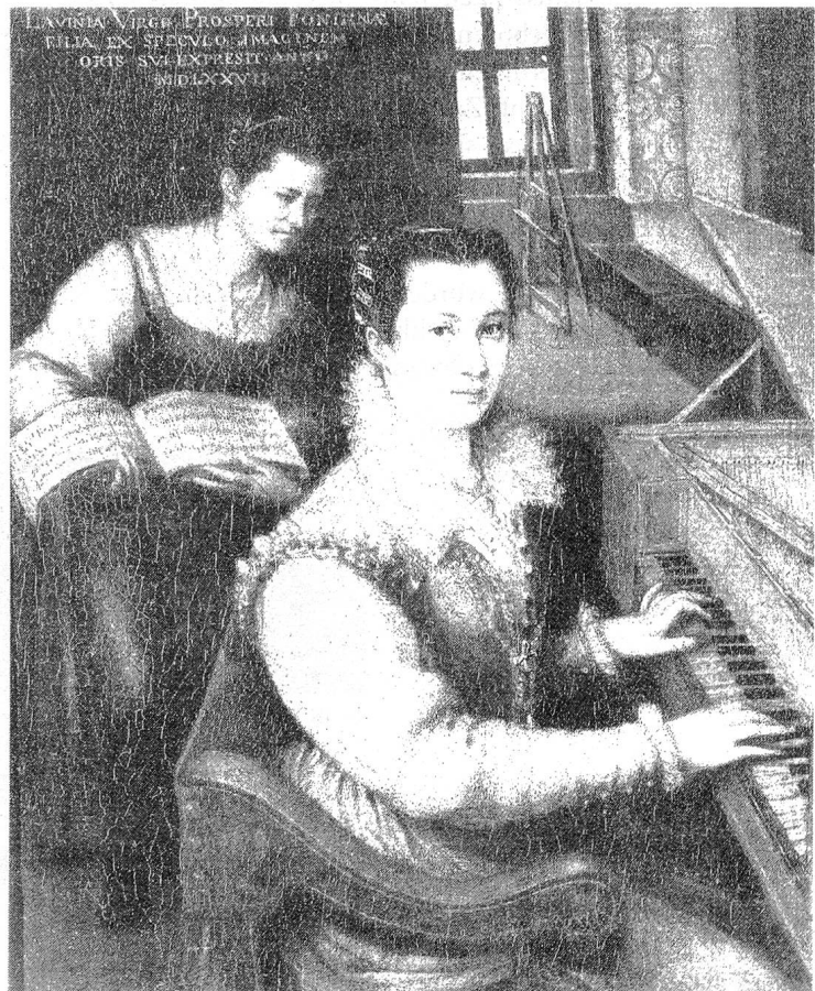
Lavinia Fontana, Selbst-Portrait am Spinett, 1577/8, Öl auf Leinwand, 27 x 24 cm, Accademia Nazionale di San Luca, Rom.

1552 wurde Lavinia Fontana in Bologna geboren. In Bologna befand sich eine der ersten Universitäten, an der Frauen überhaupt als Studentinnen zugelassen wurden. So herrschte dort sozusagen eine lange Tradition von gelehrten Frauen. Ihr Vater, Prospero Fontana, war selbst ein bekannter Maler und unterrichtete seine Tochter. Aus heutiger Perspektive scheint Lavinia sehr stark von Sofonisba Anguissola beeinflusst gewesen zu sein. Auch sie greift auf die Hinweise virgo und ex speculo und stellt sich somit in die Tradition der Jungfrau Marzia, die ihr Selbstbildnis aus einem Spiegel gemalt haben soll.