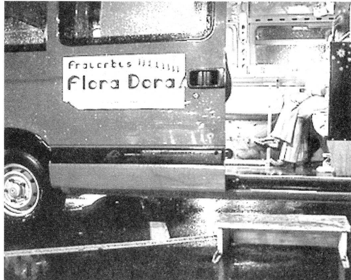
Der Bus von Flora Dora bietet den Frauen in der Beschaffungsprostitution einen Ort, um dem rauen Klima des Drogenstrichs für ein paar Momente zu entkommen.

Der Frauenbus Flora Dora in der heutigen Form entstand 1999. Im Januar 2000 wurde der Bus offiziell in das Angebot des Sozialdepartements aufgenommen und sein Angebot schrittweise ausgebaut. Lustenberger sieht dies als eine massive Verbesserung. Seit Juli 2002 ist Flora Dora auf der Suche nach einem bewilligten Standort für einen begleitenden Container für den Bus. Dieses Unterfangen