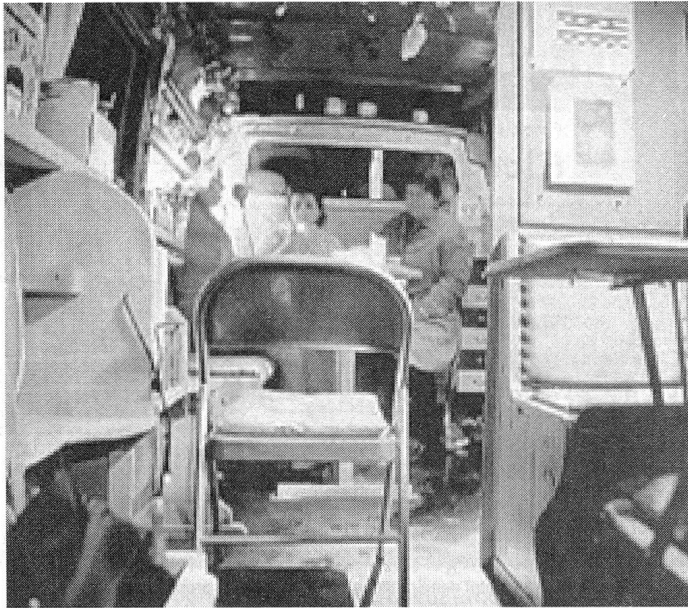
Die Platzverhältnisse im Bus sind eher beengend. Dadurch müssen die Frauen oft nahe zusammenrücken.

Neben einem offenen Ohr und Ratschlägen verfügt Flora Dora über ein festes Angebot. Kondome werden gratis abgegeben sowie Gleitmittel, Feuchttücher und Taschentücher. Zudem bietet der Bus einen geschlossenen Raum, in dem die Frauen sich austauschen können, sich mit Getränken wärmen oder sich erfrischen können. Einen sehr wichtigen Dienst bieten «Freierwarnungen». Immer wieder geschehen Übergriffe von Seiten der Freier. Die Prostituierten können sich im Bus selbst oder in verteilten Broschüren über gefährliche Freier und deren Erkennungsmerkmale informieren. Fraglich ist aber, wie viel sich die Frauen merken können, denn die Liste ist lang.