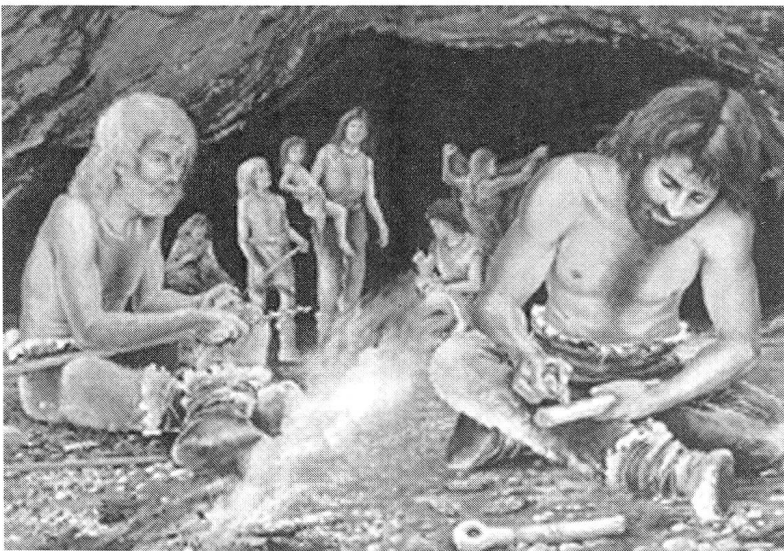
Abb 2: Die Männer im Vordergrund kümmern sich um die «wirklich wichtigen» Dinge des Daseins, während die Frauen im Hintergrund «nur» mit den Kindern und mit Hausarbeiten beschäftigt sind. Die Tätigkeiten der Männer werden systematisch auf-, die der Frauen systematisch abgewertet.

Doch zurück zu den archäologischen Lebensbildern: Ich nehme an, dass die UrheberInnen der Bilder die stereotype Präsentation des patriarchalen