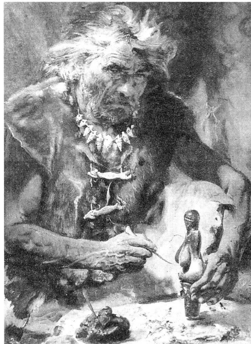
Abb 3: Klassische Sujets wie «der Eiszeitkünstler, der eine Frauenstatuette schnitzt» oder «der Bronzegiesser bei der Arbeit» suggerieren, dass die Männer die alleinigen Urheber des «zivilisatorischen Fortschritts» der Menschheit waren.

Laut Erkenntnissen der Kommunikationswissenschaft und der Medienforschung haben Bilder allgemein mehr Gewicht als Texte. Sie ziehen die Aufmerksamkeit wesentlich schneller und stärker auf sich. Botschaften, die über Bilder vermittelt werden, prägen sich wesentlich besser ein als solche in Textform und bleiben auf Dauer auch besser im Gedächtnis haften. Nicht nur das – die Bilder