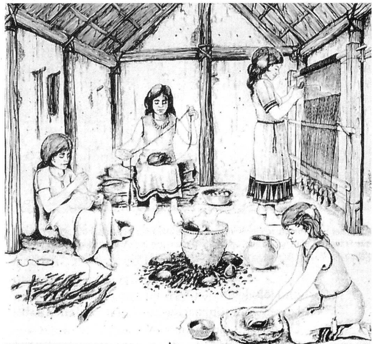
Abb. 1: Die Welt der Frauen war klein. Sie bestand in erster Linie aus Haushalt und Kindern. Ihr Leben spielt sich hauptsächlich im Haus und seiner unmittelbaren Umgebung ab.

Männer und Frauen hatten während der gesamten Urgeschichte streng getrennte Aktivitätsfelder und Aufgaben. Glaubt man den Lebensbildern, haben die Männer in allen Epochen deutlich mehr gearbeitet als die Frauen. Insbesondere die Subsistenzsicherung war überwiegend Männersache. Das Tätigkeitsfeld der Frauen war schmal und eintönig und umfasste hauptsächlich folgende Aufgaben: Kinderbetreuung, Zubereitung und Konservierung von Nahrungsmitteln, Wasser holen, das Sammeln von essbaren Pflanzen sowie die Herstellung und Verarbeitung von Leder und Textilien. Ihre Welt war klein, denn sie bestand in erster Linie aus Haushalt und Kindern. Folglich hatten Frauen auch einen kleinen Aktionsradius; ihr Leben spielt sich hauptsächlich im Haus und seiner unmittelbaren Umgebung ab (Abb. 1).