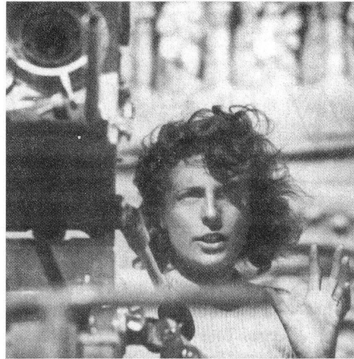
Leni Riefenstahl bei der Arbeit zu ihrem Film «Tiefland», 1940.

Zielen der Nazis entspricht: Die Nazi-Ästhetik, welche, wie oben ausgeführt, neben der Vorstellung des «perfekten» Körpers auch klare Vorstellungen davon hatte, wie «un-