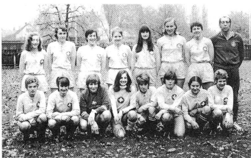
Länderspielpremiere in Schaffhausen 1970.

Wurde der Frauenfussball in Frage gestellt oder ins Lächerliche gezogen, so hoben zahlreiche Medienschaffende gleichzeitig kämpferische oder gar kriegerische Elemente hervor: «Immer wieder machen