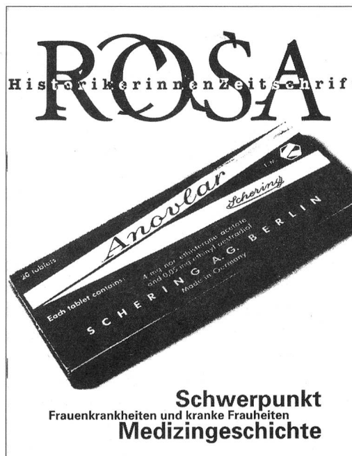
Mehr kopiert denn gelayoutet: Titelbild der Nr. 12, April 1996

«Als vor einigen Jahren die ROSA entstand, fand ich es eine gute Idee. Die ROSA-Gründung fiel in eine Situation, da es kaum Zeitschriften zum Bereich der Geschlechterforschung gab. Nicht in der Schweiz und auch nicht viele im deutschsprachigen Raum. Ausserhalb der HistorikerInnentagung fand sich kaum Platz für Themen der Gender Studies. Die