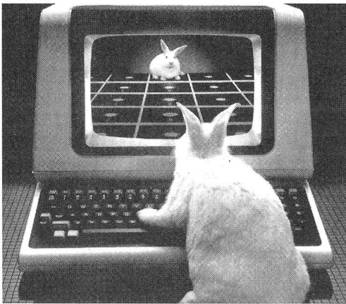
Selbständige Vervielfältigung in der virtuellen Welt.

Diese ambivalente Situation ist wie gesagt nicht gerade unproblematisch. Haraway wird an dem Punkt, wo man endlich Näheres über das genaue Funktionieren dieses doppelten Blickwinkels erfahren möchte, reichlich vage und schönrednerisch. In den «unheimlichen neuen Netzwerken», die alte hierarchische Systeme ablösen und neue Formen von Regulierungsmechanismen hervorbringen – sie nennt diese «Informatik der Herrschaft» – sieht sie gerade auch die Möglichkeit zu subversiven Fusionen: «Vernetzung» ist nicht nur eine multinationale Unternehmensstrategie, sondern