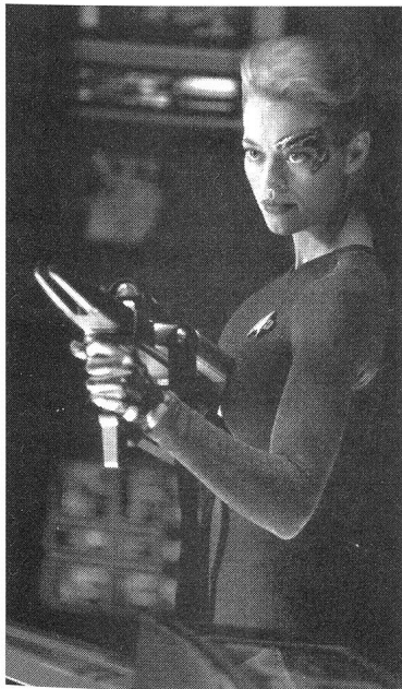
Frau ist Technik: Befreiter Cyborg 7-of-9.

Dieser Trend zur Gleichberechtigung in technischen und führenden Positionen sollte auch in der nächsten Spinn-off-Serie «Deep Space 9» (1993–1999) fortgesetzt werden. Dem Kommandanten der Raumstation stand eine weibliche