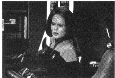
Frau darf nun an die Technik: Chefindgenieurin Torres.

Domänen von Frauen eindeutig herausgefordert. Die Betonung liegt hier auf dem Wort «herausgefordert». Denn anders als in den bisherigen Serien, in denen der männliche Vorrang ex ante gegeben war, mussten sich die Frauen auf der Voyager zunächst – ironischerweise – gegen ihre Selbstzweifel und dann – bezeichnenderweise – gegen ihre männlichen Konkurrenten durchsetzen. Beides ist ihnen hervorragend gelungen: Spätestens ab der zweiten Staffel konnte niemand mehr an den wissenschaftlichen und technischen Fähigkeiten von Captain Janeway und Chefindgenieurin Torres zweifeln. Im