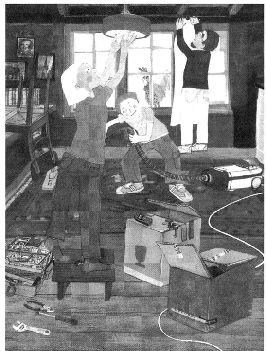
In Kinderbüchern selten anzutreffen: Männer bei der Hausarbeit.

Es ist ihnen vermutlich kaum bewusst, dass eine Überpräsenz an männlichen Darstellern es den Kindern erschwert, überhaupt unterschiedliche Frauen- und Mädchenbilder für die geschlechtsspezifische Meinungs- und Einstellungsbeeinflussung aus den abgebildeten Figuren ziehen zu können. Genau das wäre jedoch für Mädchen, aber auch für Knaben dieses Alters von grosser Wichtigkeit, da positive und facettenreiche Frauenbilder als Vorbild