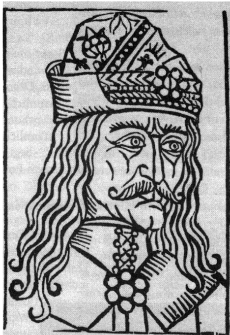
Vlad Draculas Vorgänger waren weiblich.

In der ersten Hälfte des 18. Jahrhunderts erregen Funde von nicht verwesenden Leichen in Dörfern im Balkanraum das wissenschaftliche Interesse in Europa. So berichten Ärzte von einem Toten, der 40 Tage nach seinem Ableben ausgegraben wurde, «das er ganz vollkommen und unverwesend sey, auch ihm das frische Blut zu den Augen, Nasen, Mund und Ohren herausgeflossen, das Hemd, Übertuch