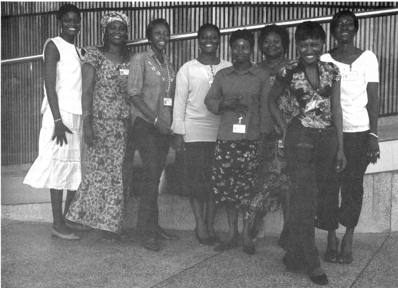
Die Frauenstimmen des Sondergerichtshofs in Sierra Leone.

Es gab nach dem Krieg verschiedene Projekte, die sich verschiedenen Arten von Traumatisierungen annahmen. Dazu gehörte auch die sexuelle Gewalt. Mädchen konnten sich bei Organisationen melden, wo sie sich von mehr oder weniger gut ausgebildeten psychosozialen BeraterInnen Unterstützung holen konnten. Zudem gab es Selbsthilfegruppen. Die Entwaffnungsprogramme selbst waren aber vorrangig dazu da, dass die Waffen abgelegt wurden und dass es attraktiv sein sollte für die Jugendlichen, die Waffen abzugeben. Idiotischerweise haben die Organisationen am Anfang jedem 100 Dollar gegeben, der die Waffen abgab. In der Wahrnehmung der Opfer sah das so aus, als