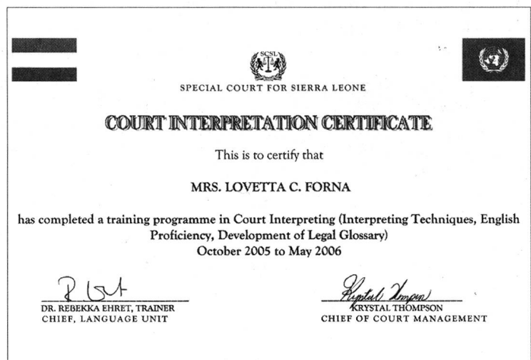
Das Zertifikat für die ÜbersetzerInnen am Special Court.

Es ging im Grossen und Ganzen darum, die weiblichen und männlichen Stimmen zu vertreten und damit ein Geschlechterbewusstsein aufzubauen. Ziel war es, dass auch weibliche Stimmen mit dem Gericht in Verbindung gebracht werden. Es gab ja auch Radiomitschnitte der Gerichtsverhandlungen, die ausgestrahlt wurden. Und da sollte man eben auch weibliche Stimmen hören. Ausserdem wurden Videozusammenschnitte des Sondergerichtshofs in den Dörfern gezeigt. Da habe ich auch geschaut, dass weibliche Stimmen von weiblichen Dolmetscherinnen gesprochen werden. Es ging mir wirklich darum, dieses Geschlechterbewusstsein