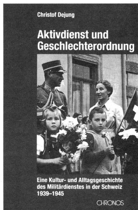
Dissertation von Christof Dejung

im Zeitraum des Aktivdienstes zu einer gesamtgesellschaftlichen Leitvorstellung geworden sei (S. 29/142). Konsequenz davon sei die Polarisierung der Geschlechterordnung (S. 15/399f.) mit Nachwirkung bis weit in die 1960er-Jahre. Damit entlastet Dejung die Zivilgesellschaft in unzulässiger Weise. Es gibt keine Hinweise, dass vor dem Aktivdienst die politische oder gesellschaftliche Situation für die Frauen günstiger war als während oder nachher. Die Kultur soldatischer Männlichkeit stellt eher ein Symptom für die Verfassung der damaligen Zivilgesellschaft dar, deren politische und ökonomische Eliten, wie Dejung postuliert, im