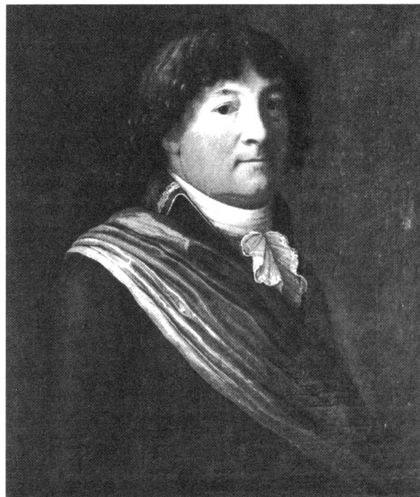
Unter den strengen Augen des Patriarchen Peter Ochs.

Väter spielten im Hinblick auf die Neuverhandlung der Geschlechterrollen in der Aufklärung eine wichtige Rolle. Meine Dissertation hat deshalb Väter und Söhne im Bürgertum der Deutschschweizer Städte Basel, Bern und Zürich für den Zeitraum zwischen etwa 1750 und 1830 zum Inhalt. Dabei