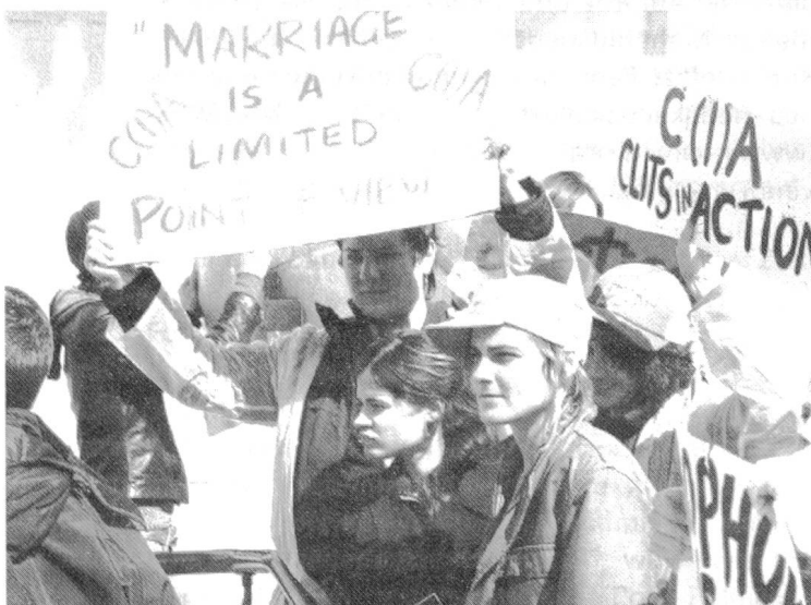
Itty-Bitty-Titty-Committee: So macht Engagement Spass

Die heute deutlich breitere Sichtbarkeit und Normalität für verschiedene sexuelle Orientierungen und Identitäten eröffnet neue Räume für vielfältigere Identifikationen. Lesben, Schwule, Bisexuelle, Transgender oder Transsexuelle werden durchaus differenziert und individuell dargestellt. Diese Sichtbarkeit trägt auch ins letzte provinzielle Wohnzimmer, dass es auf dieser Welt auch etwas anderes als die heteronormative Klein- und Kleinstfamilie gibt. Die dargestellten