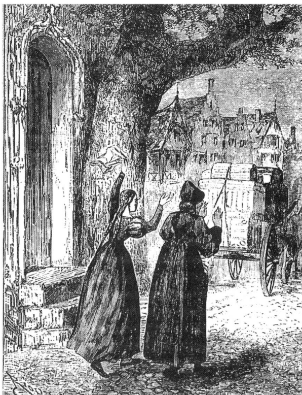
«Schwache Mädchen» winken den Abenteurern «Ade!»

Vieles spricht dafür, dass die Gründe dieser Popularität nicht allein in zeitgeschichtlichen, soziokulturellen Umständen, sondern auch in der Charakteristik der Figur selbst liegen. Der bürgerliche Abenteuerer besitzt viele Eigenschaften, die ihn den vom (Arbeits)alltag eingeschränkten LeserInnen attraktiv erscheinen lassen: Aktivität, Ausstrahlung, Selbstbewusstsein, Durchsetzungskraft, Beherrschung abenteuerlicher Räume, Freiheit und Ablehnung einer auf der bürgerlichen Ordnung