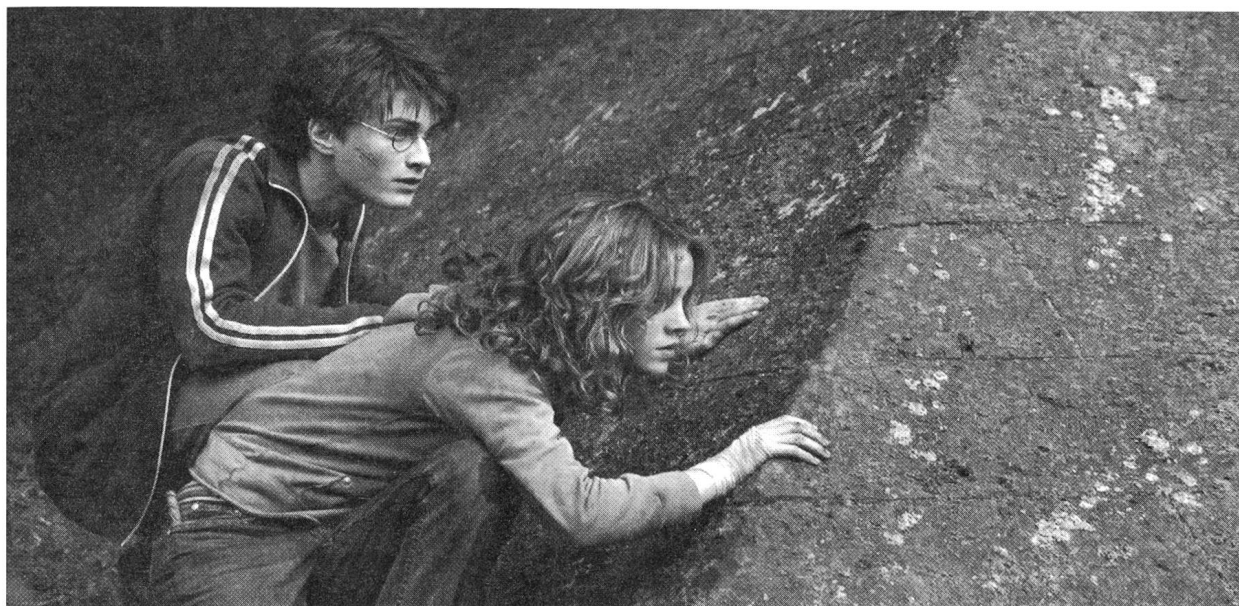
...und Mut sind die Eigenschaften der neuen AbenteuerheldInnen

alles Unsinn. Zauberstäbe sind nur so mächtig wie die Zauberer, die sie benutzen. Manche Zauberer brüsten sich einfach gerne damit, dass ihre grösser und besser sind als die anderer.» In Hermiones Worten ist mehr als eine augenzwinkernde Absage an männliche Omnipotenzphantasien enthalten: Wer Erfolg haben will, so ihre Überzeugung, hat sich diesen durch harte Arbeit selbst zu erwerben. Wenn Hermione sich im dritten Zaubererschuljahr einen Time-Turner beschafft, mit dessen Hilfe sie mehrere Lektionen zugleich absolvieren kann, scheint aber auch die Ambivalenz dieser Haltung auf. So wird in ihrer Figur zum einen das Potential sichtbar, das Wissen in der Informationsgesellschaft birgt, und das zur kritischen politischen Partizipation führt – anders als Ron und Harry lässt sie sich auch von subtilen Ideologien nie manipulieren. Zum anderen spiegelt sich in ihrem Ehrgeiz ein in pädagogischen Debatten aktuelles Bild: Das der fleissigen Mädchen, die ihre männlichen Mitschüler in intellektuellen Belangen überflügeln.