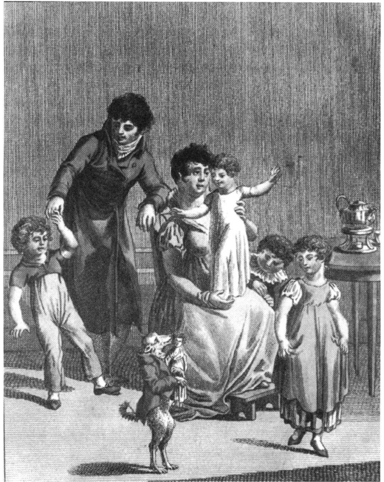
Wie natürlich ist ein tanzender Hund?

Agency wird meiner Meinung nach den Tieren auch nicht gerecht. Ich kann Latours Theorie gut nachvollziehen, aber bei den Tieren geht es meiner Meinung nach auch noch um etwas anderes: Tiere leben in einer Beziehung zu den Menschen, oft in einer affektiven Beziehung, und dieser Tisch oder Becher in der Regel nicht. Da, denke ich, gibt es wie eine Zwischenschnittstelle, die theoretisch noch nicht austariert worden ist, und das ist jetzt die grosse Chance und auch die grosse Herausforderung der Tiergeschichte.