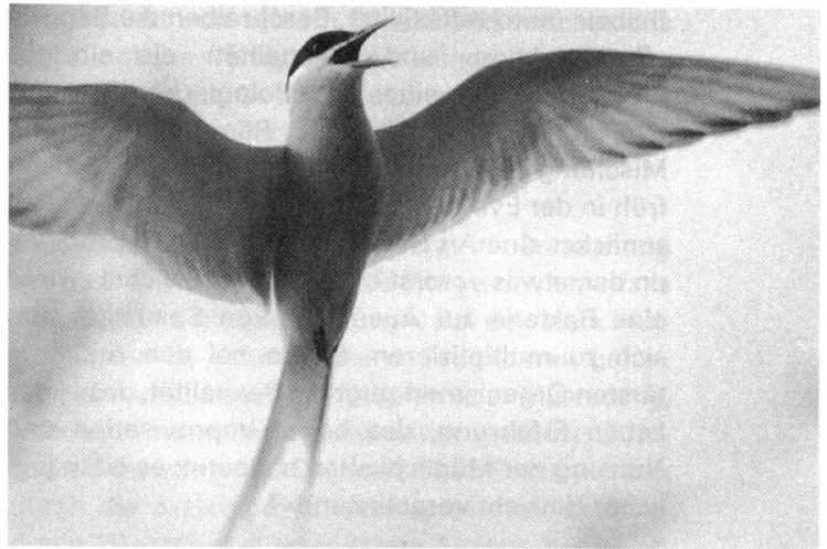
Die Meeresschwalbe findet auf der Suche nach einer/einem PartnerIn...

Zwei Fallstricke müssen allerdings vermieden werden. Einerseits müssen wir davon absehen, Fragen bezüglich der menschlichen Sexualität über den Umweg der Tiere zu stellen und dabei mit der Naturalisierung von Sexualität und menschlichen, sozialen Beziehungen voranzuschreiten. Umgekehrt soll auch das sexuelle Verhalten der Tiere nicht anhand von dem Menschen eigenen Kategorien erklärt werden. Das heisst, es soll vermieden werden von Vergewaltigung, Homosexualität, Sadismus, etc. bei dieser oder jener Tierart oder diesem oder jenem Tierindividuum zu sprechen. Wir müssen aufpassen, dass unser Vorhaben nicht zur Assimilation von Gleichem mit Gleichem führt. Die Idee, wonach das Tier vollständig im Kreise seiner Triebe eingeschlossen und in diesen unausweich-