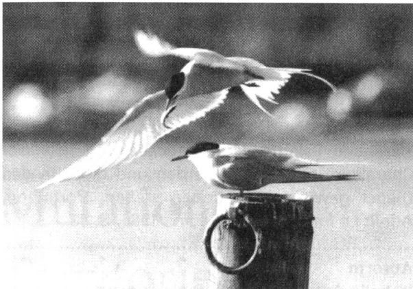
Ernährung oder Präsent?

der sexuellen Aktivität. Sie löst sich somit von allen hierarchischen Betrachtungsweisen, die «minderwertige» Bedürfnisse «überlegenen» gegenüberstellen. Die sexuelle Aktivität erscheint auf diese Weise als eine Art Selbst-Aktualisierung, die das Leben des individuellen Organismus an sich zum Ausdruck bringt. Das Kontinuum, das Tier und Mensch zusammenführt, zeigt sich hierbei in jenem Sinne deutlich, als dass das Leben-nach-Trieben die Basis für die «natürliche» Erscheinung der Subjektivität des Selbst (subjectivité egoïque) oder für den Geist bildet. Allerdings muss das – meiner Meinung nach wichtige – Prinzip beibehalten werden, nach welchem es eine Diskontinuität zwischen Tier und Mensch (einschliesslich des Menschenaffen) gibt. Diese Diskontinuität darf jedoch nicht von der Tatsache überdeckt werden, dass es andere Diskontinuitäten zwischen unterschiedlichen Tierarten und unterschiedlichen sozialen oder lebenden Organisationsformen gibt. Es geht um «eine unendliche Abweichung der Zustände», um «Knäuel von Verhaltensweisen und Bewegungsfreiheit, um Kontinuitäten, um Angrenzungen mit Sprüngen, um Variationen und Vereinigungen». 6