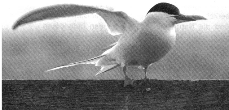
...ein spezifisches Individuum.

Wenn es Phänomene des Sexuellen seit den ersten Manifestationen des Lebens gibt, gehört die Sexualität der Tiere der Ordnung des Verhaltens an. Die Vielfalt und Komplexität der Verhaltensweisen beim Hofieren jedoch laden dazu ein, das «Verhalten» als Projektion und Darstellung des Tieres in seiner Umwelt zu verstehen. Natürlich variieren Intensität und Komplexität des Verhaltens je nach Spezies. Sie sind dort kaum vorhanden, wo die Befruchtung äusserlich ist, wie bei vielen Meeresschwämmen, bei welchen die sexuellen Emissionen getrennt in der Umwelt des Meeres ausgesondert werden und sich aufs Geraatewohl treffen; oder bei bestimmten Amphibien, bei welchen die Männchen die Eier der Weibchen direkt befruchten, ohne jene tatsächlich zu «treffen». Meistens jedoch benötigt die Befruchtung die aktive Beteiligung von sexuierten Eltern, Besitz und Verteidigung eines Territoriums durch das Männchen und/oder Zeremonielle, Annäherungsstrategien, Akrobatik, Tänze, Gesänge, Paraden, etc. Die Ver-