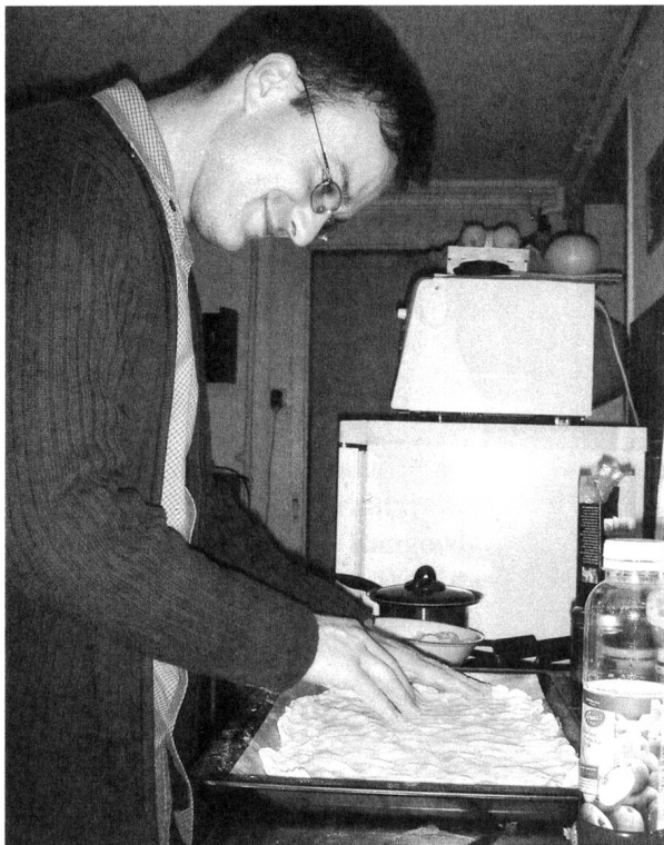
...wirst du dein Brot essen» Gen 3,19