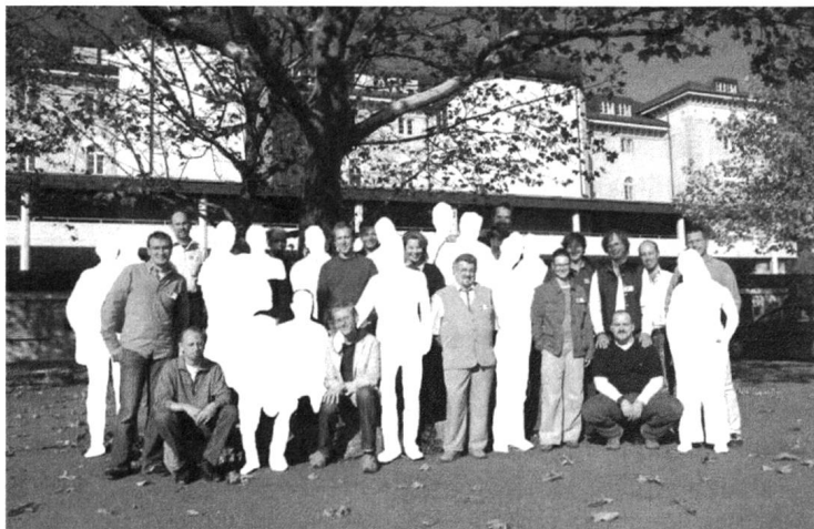
Die Partnerinnen und Partner, die mensch nicht zeigen darf.

Der Begriff «Queer», hergeleitet vom deutschen (ver)quer, ist gekennzeichnet durch seine heterogene Deutung und Anwendung. Dabei kann «Queer» als Selbstbezeichnung fungieren, wie auch eine politische Strategie oder ein theoretisches Feld benennen. Die Anwendung des Begriffs gestaltet sich jedoch aufgrund der zunächst negativen Konnotation als Fremdbezeichnung insbesondere als Charakterisierung von Subjekten als schwierig. «Queer» als Selbstbezeichnung oder Eigendefinition stellt eine affirmative Aneignung eines zunächst abwertenden Begriffs der Fremdbezeichnung v.a. von Schwulen und Lesben dar, welche in den 90er Jahren vornehmlich im US-amerikanischen Raum populär wurde. Im Zuge einer Kritik an dem «normalen» und «natürlichen» Charakter von Heterosexualität entwickelte sich