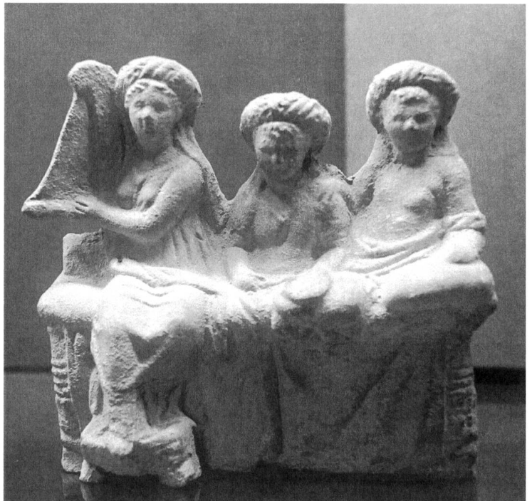
Nicht religiös, aber sehr wohl philosophisch aktiv: Hetären.

Doch – o Wunder – ein genauer Blick in die entsprechenden Bibelstellen bestätigt die Zweifel daran, dass es das Phänomen Kultprostitution jemals gegeben hat. Schon allein der Befund ist mit nur 8 Stellen 4 , an denen im gesamten Alten Testament von solchen «Geweiheten» die Rede ist, dermassen gering, dass nur wenig über sie in Erfahrung gebracht werden kann. Sodann sind die Bezeichnungen, die von der hebräischen Wurzel «heilig/ausgesondert/geweiht» abgeleitet sind, in ihrer Verwendung offensichtlich bereits in altisraelitischer Zeit unsicher. Zumindest zeigen dies die differierenden Wiedergaben in den ältesten Übersetzungen ins Aramäische und Griechische bis hin zu blossen Transkriptionen. Wenn schon die ältesten Übersetzenden keine eindeutige Bedeutung wussten, wie können wir Heutige im Brustton der Überzeugung von «Kultdirne» oder «Buhlknechten» sprechen? Lediglich an einer Stelle (Gen 38) werden die Worte für eine weibliche Geweihte und eine gewöhnliche Prostituierte geradezu synonym verwendet. Warum dies so ist, ist rätselhaft. Als Beleg für ein verbreitetes altisraelitisches oder altorientalisches Phänomen der kultischen Prostitution genügt es nicht. Zumal die besagte Stelle eine ausgefeilte Erzählung über einen betrogenen Betrüger sowie das Recht einer Frau auf ihren Ort