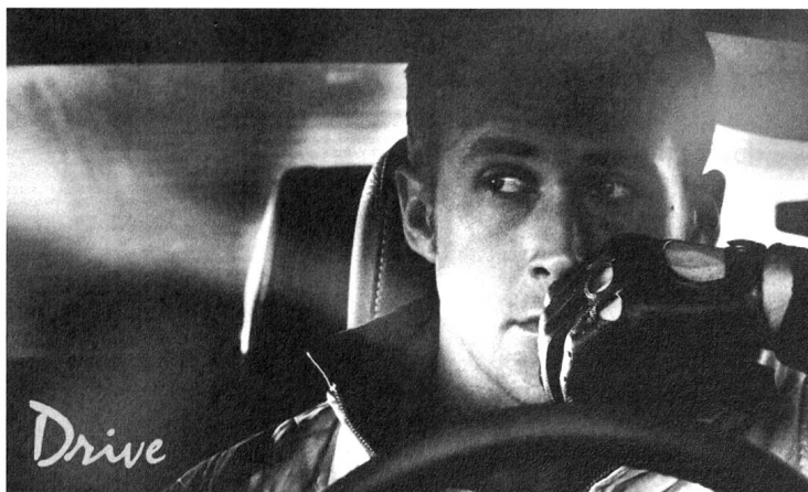
Er ist so sehr Held, dass er noch nicht einmal einen Namen braucht.

Wer heute ins Kino geht, den Fernseher einschaltet, auf iTunes Musik hört – an Märchenstoffen führt zur Zeit kein Weg vorbei – ob Prince Charming in «Drive», immer wieder Schneewittchen (z.B. die Filme «Mirror, Mirror» oder «Snow White and the Huntsman»), oder ein Nachfahre der Brüder Grimm, der ein Doppelleben als Polizist und Monster-Bekämpfer führt (TV-Serie «Grimm») oder gar die Erschaffung eines neuen Märchen-Almanachs in Form einer Fernsehserie («Once Upon A Time») – Märchenstoffe werden neu verwoben. Neu verwoben nicht nur mit sich selbst, sondern auch mit neuen Medien, neuen Erzählformen und der Alltagsrealität des 21. Jahrhunderts. Im Gegensatz zu den Shrek-Filmen verstehen sich die neuen Märchenadaptionen nicht in erster Linie als Parodien, sondern leuchten mit Hilfe der einerseits aus vergangenen Zeiten stammenden und andererseits allseits bekannten Märchenmotive