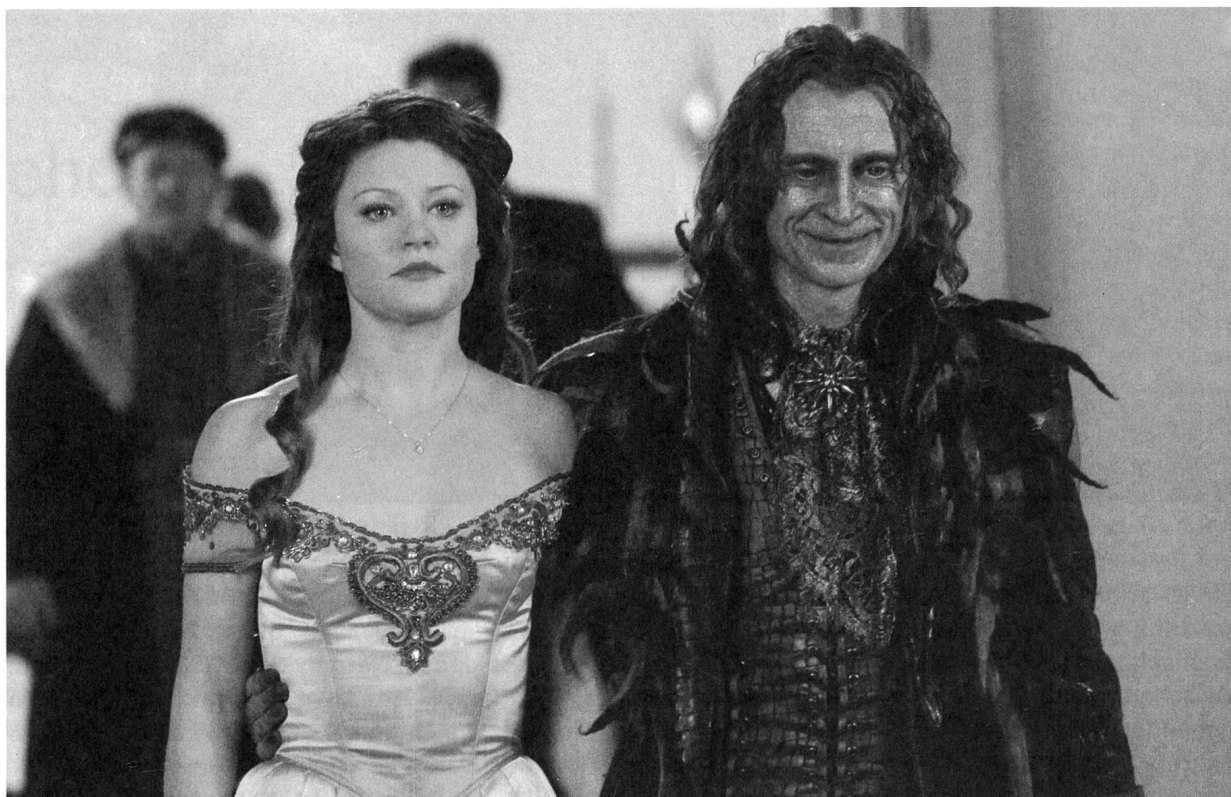
Zufrieden mit sich selbst: Rumpelstilzchen/das Biest erwirbt Belle durch einen seiner Deals.

die Frage: Hat er nun an Macht eingebüsst wegen seiner Liebe und Verletzlichkeit oder wegen seiner unkontrollierten Gewalttätigkeit? Ist «das Weibliche» oder «das Männliche» seine Schwäche? Um diese Frage beantworten zu können, bedarf es der Vorgeschichte aus dem Märchenland.