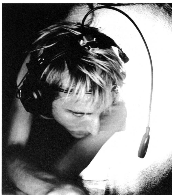
Selbsternannter Cyborg: Neil Harbisson