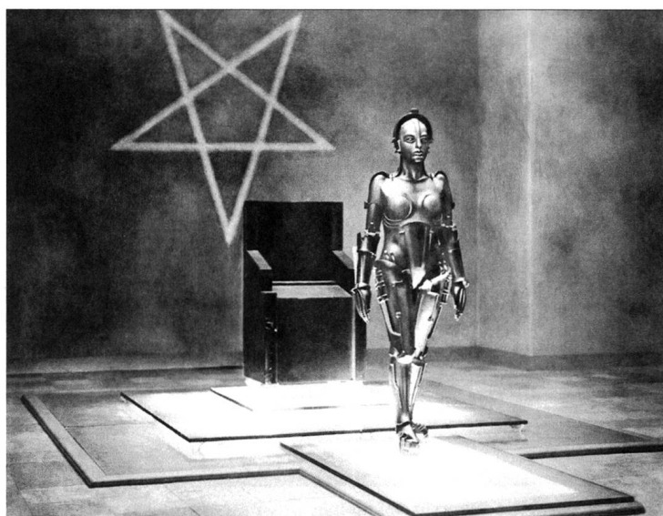
Maria aus Fritz Langs Metropolis

Gerade weil der Cyborg in sich die Ambivalenz von natürlicher und künstlicher Materialität vereint,