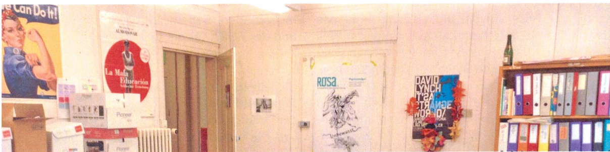
Jetzt noch farbig, bald leergeräumt wird sie nochmals selber ein Fundstück - die Uni-Redaktion.