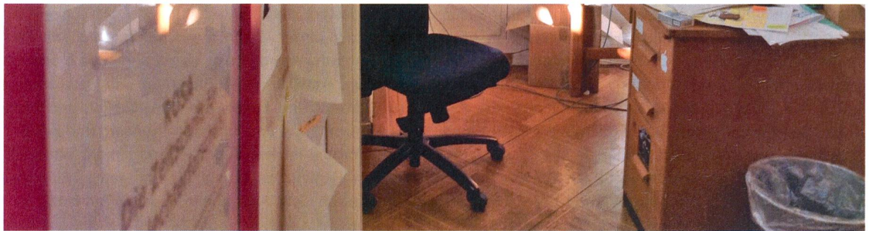
Fundstück mal anders: Was ist rosa in der ROSA-Redaktion?