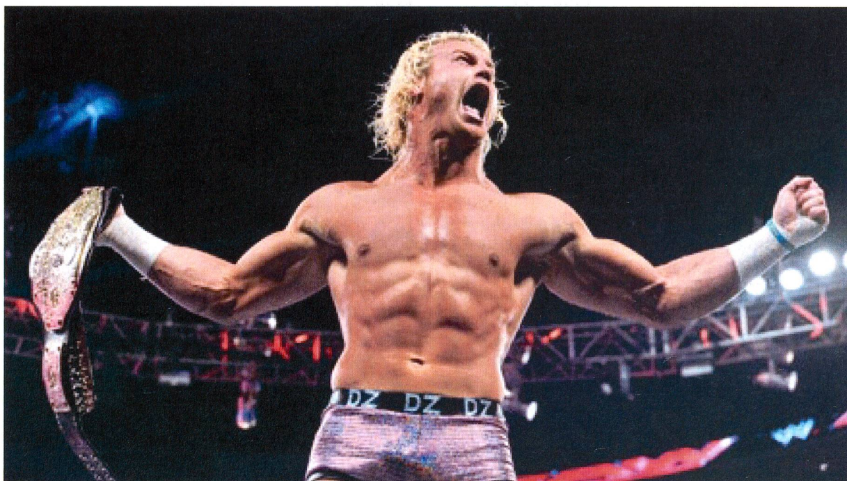
Dolph Zigglers furchteinflössende Pose in rosa Glitzer-Hotpants.

die Farbe Rosa im Wrestling-Sport bis zum heutigen Tage Kontroversen auszulösen vermag. Nie sind Wrestler unbeliebter, als wenn sie Rosa tragen. Nie schaffen es andere Athleten, soviel Hass und Beschimpfungen auf sich zu ziehen. Umso erstaunlicher ist es, dass eine Farbe soviel Einfluss hat und die Gemüter derart erhitzen kann. Ob sich dies, gerade in dieser von und durch Männer dominierten und auf ein stereotypes Bild von Männlichkeit ausgerichteten Sportlandschaft, so schnell ändern wird, wage ich zu bezweifeln.