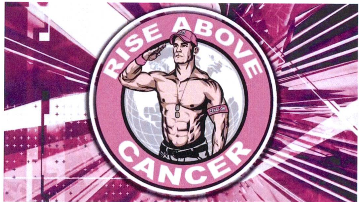
John Cenas rosa Kampf gegen Krebs

Heller stellte in ihrer Befragung aus dem Jahre 1989 fest, dass sich «Bei der Farbe Rosa [...] die Farbsympathien von Frauen und Männern deutlicher als bei jeder anderen Farbe [unterscheiden].» 3 Demzufolge gaben fast genauso viele Frauen an, Rosa schöner zu finden, als alle anderen Farben, wie Männer aussagten, die Farbe völlig abzulehnen. Bei keiner anderen untersuchten Farbe ergab sich ein solch polarisierendes Ergebnis. Ausgehend von dieser Tatsache kann angenommen werden, dass gerade durch diese Aversion gegen Rosa, welches als das «schwache Rot» und somit für das «schwache Geschlecht» steht, eine Antipathie gegenüber einem Sportler