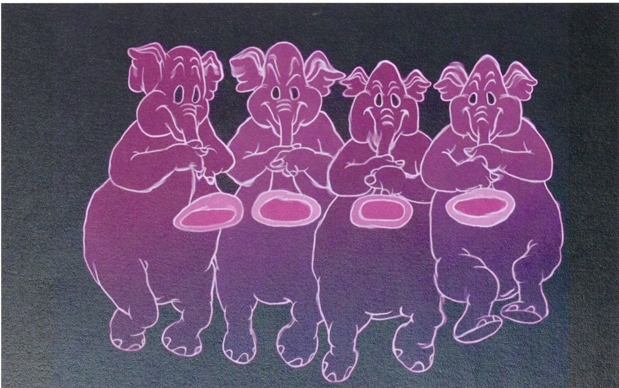
Ob Dumbo einem Rausch von Walt Disney entsprungen ist?