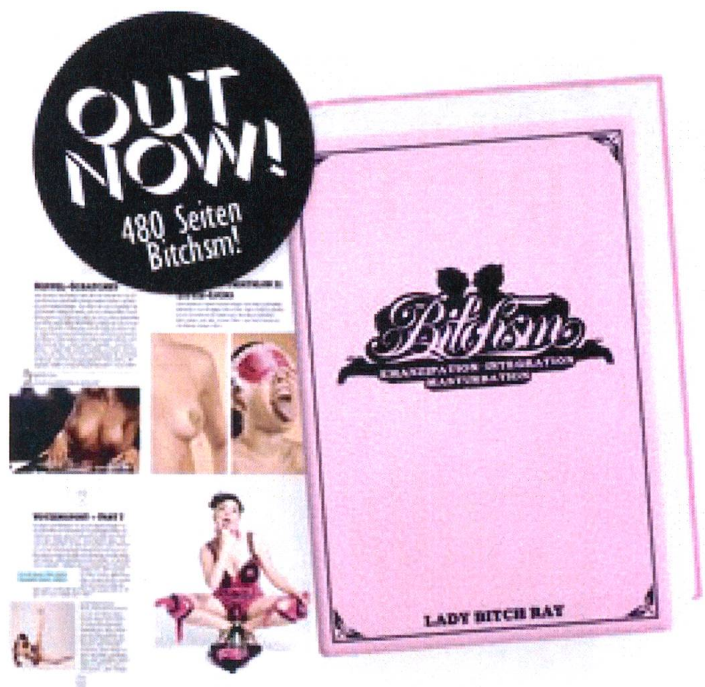
Über den Reiz der rosa Körperzonen

Dies trägt zu einem ruhigen, harmonischen Bild bei, welches Sanftheit und Zartheit des Inhaltes verspricht. Das durch die Farbe Rosa vermittelte Bild von Harmonie stimmt allerdings mit den Inhalten nicht gänzlich überein: So müssen sich in jedem Roman von Nora Roberts, die (ausnahmslos) weiblichen Protagonistinnen mit gefährlichen Situationen auseinandersetzen, wie beispielsweise mit internationalen Schmugglerringen, Jagden nach wertvollen Statuen oder Suchen nach dem Mörder einer Freundin. Das harmonische, rosa-