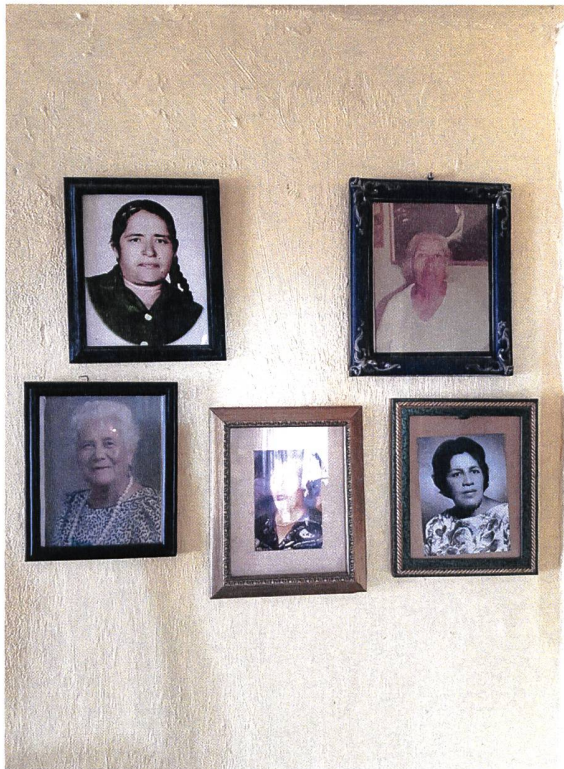
Paloma Ayala, Letters from Onion Island , Recherche, 2019