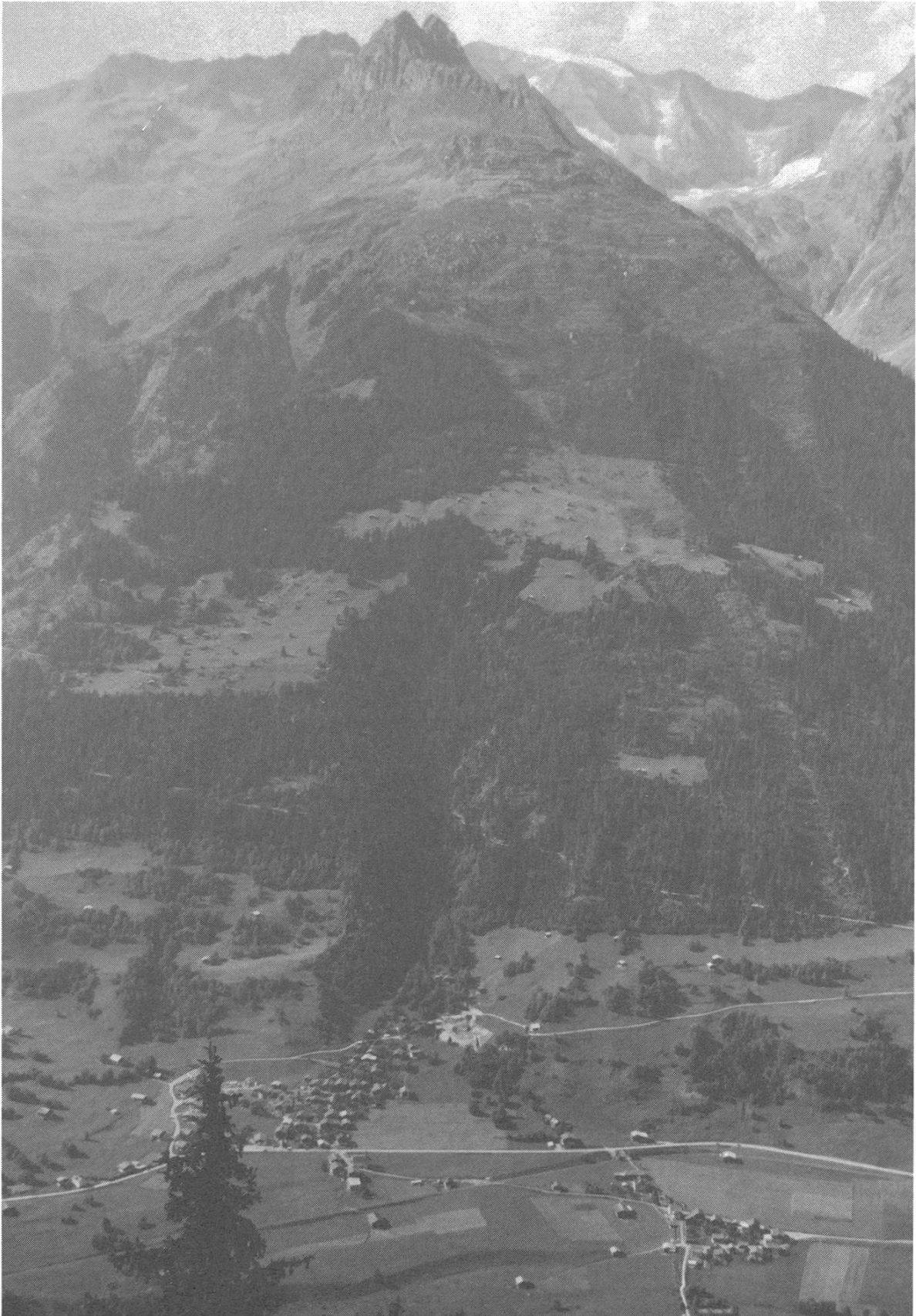
Das Gebiet von Campliun bis hinauf zum Péz Ner.