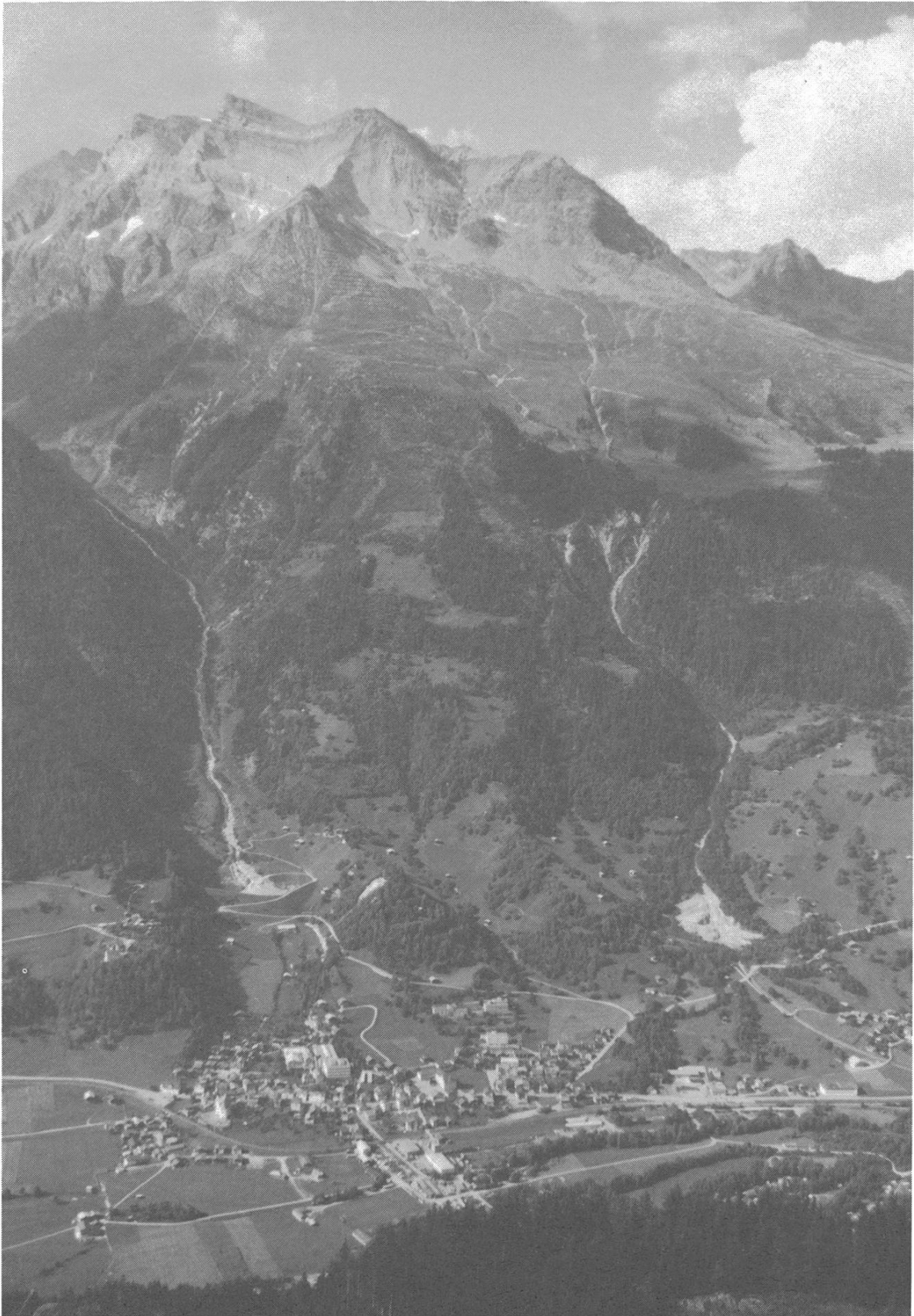
Das Dorf Trun und der linksrheinische Hang. Im Hintergrund die Bergspitzen Péz Frisal, Crap Grond, Cavistrai und Péz Tumpiv.