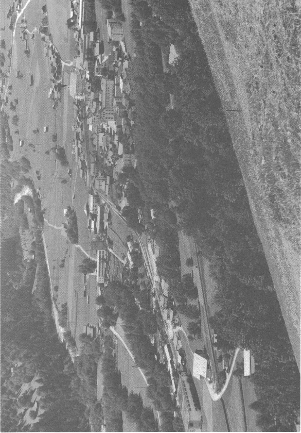
Trun und das Kulturland südwestlich davon.