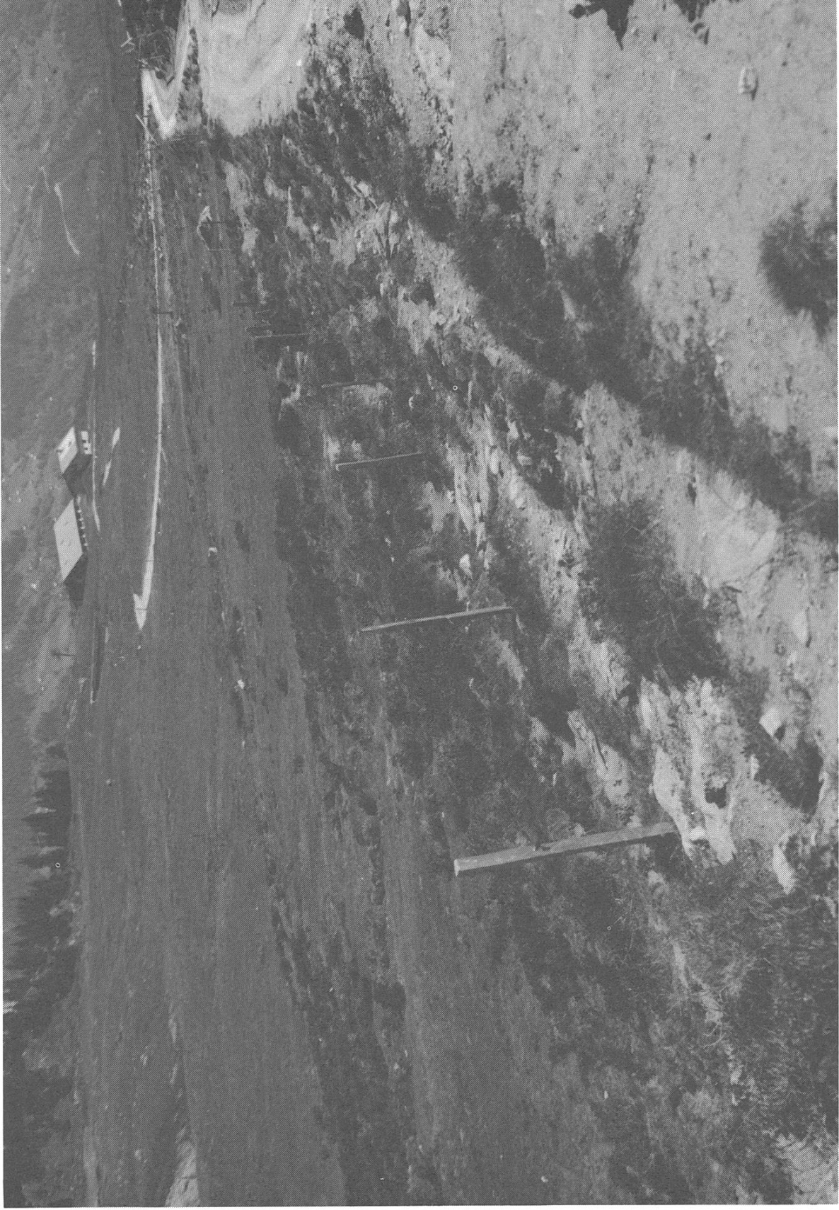
Die Gebäude der Alp Nadel's Davon und das Weideland südwestlich davon.