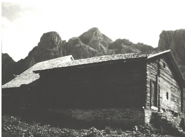
Il «Huis», la chasa-cumin dals Gualsers da Palfris, bajegiada l'onn 1409.

1409 sco data da la construcziun. Cuntrari a la chasa-cumin è la chaplutta si Palfris scumparida. Sin il plan da l'alp Palfris, conservà en la laudaun d'alp, èn ses mirs da fundament marcads cunfinant als