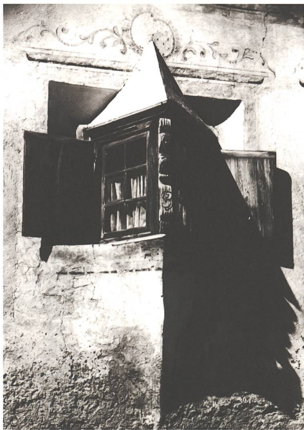
Balcun tort triangular a Bravuogn.

Là enconusch' ins il pled, dentant cun in'otra significaziun: en sursilvan è in barcun quai ch'è en Engiadina in üschöl , ed en Surmeir manegia ins cun quai er in nischa en il mir da chadafieu.