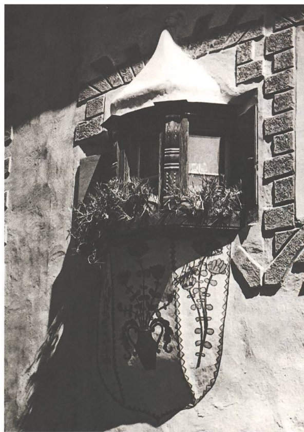
Balcun tort poligonal ad Ardez.