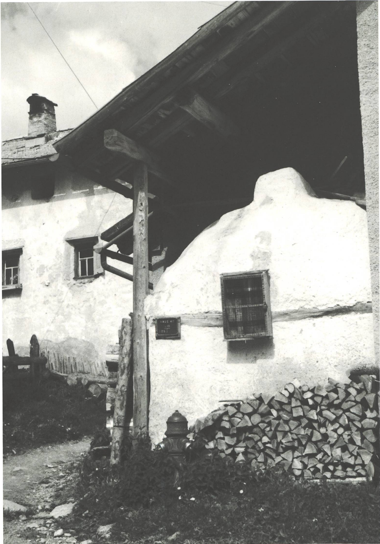
Fuorn da pan a Maton.