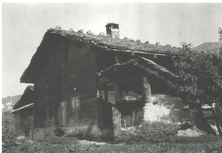
Il fuorn nun es qua dalönch da la chasa, ma listess üna construcziun separada (Sursaissa).

Uschea a Brinzouls: «Quel tgi vut far pang l'oter se, stò lascher a savair la seira avant agl suprastant e paer 20 raps.» Uschea giaiva quai a man eir a Ruschein: «Tgi che damonda igl emprem, fa igl emprem.»