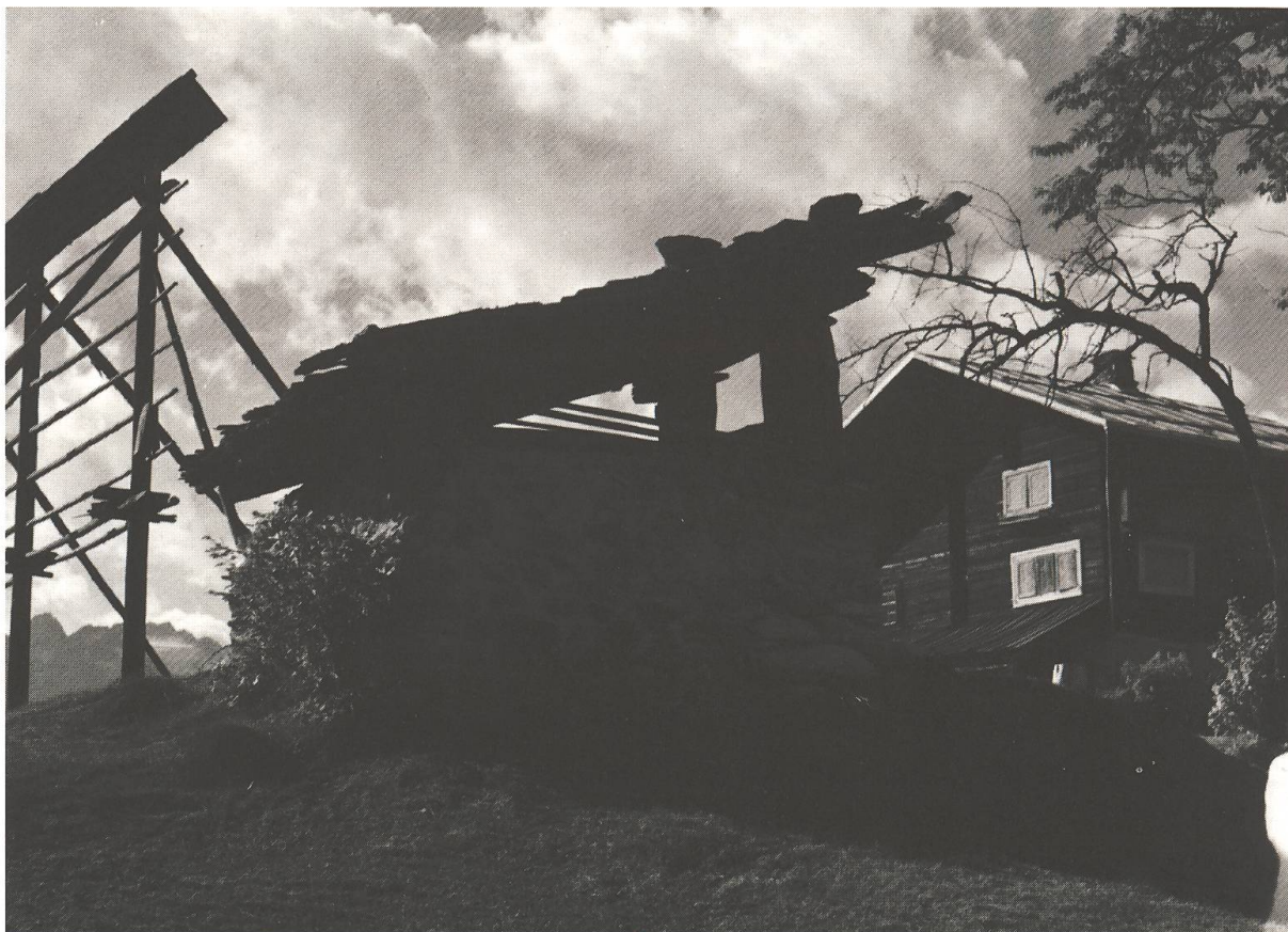
Fuorn da pan sper üna chasa da lain. A schnestra ün chischner per sechar il gran (Sursaissa).

La temma dad incendis es bain statta il motiv, perche chi's ha promovü il sistem da couscher pan in ün agen local, davent da las chasas. Quai avaiva eir dachefar cul material da construir. In Grischun central ed in Surselva sun las chasas bler da lain, dafatta la chadafö es da lain. In Engiadina sun las chasas inamöd da crap massiv, e la chadafö veglia es mürada intuorn ed intuorn per redüer apunta il privel da fö. E per ün fuorn da pan laiva quai üna vaira chalur!