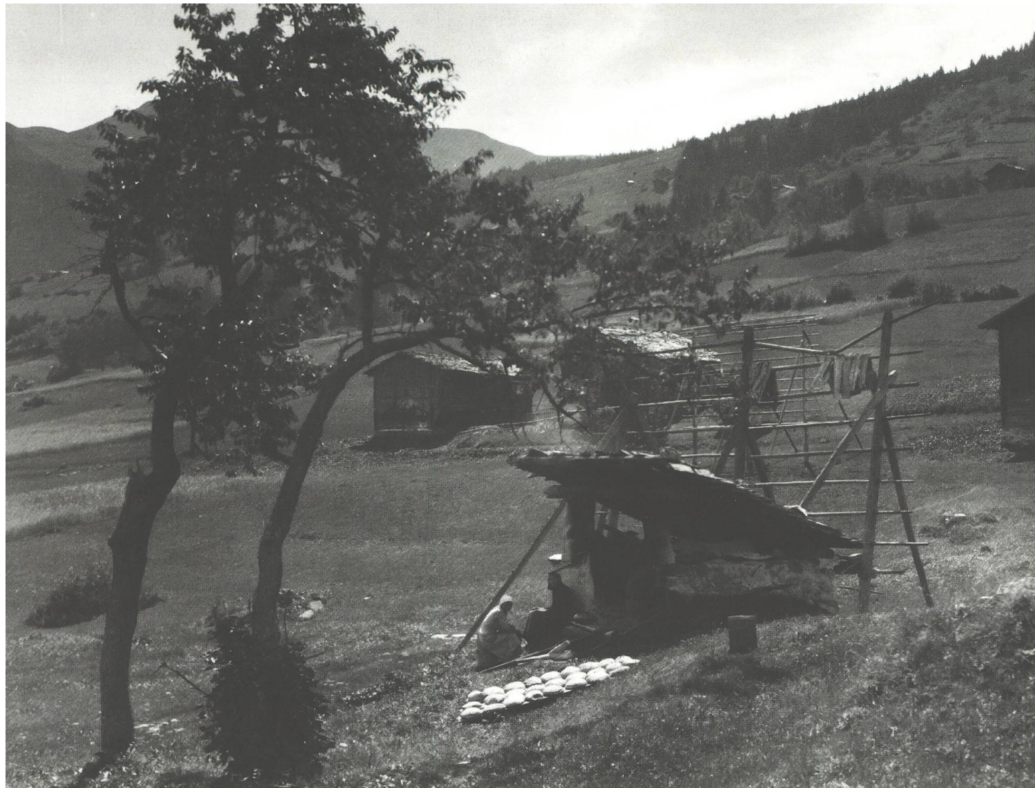
Fuorn da pan a Meierhof, Sursaissa, dal 1925.

camonda duront 3 dis en roda allas femnas cu ellas han da turschar la pasta, era cu ellas han da far si, vegn sez cullas aissas e porta lu il paun ord casa en fuorn, prenda ora e porta alla patruna en casa.»