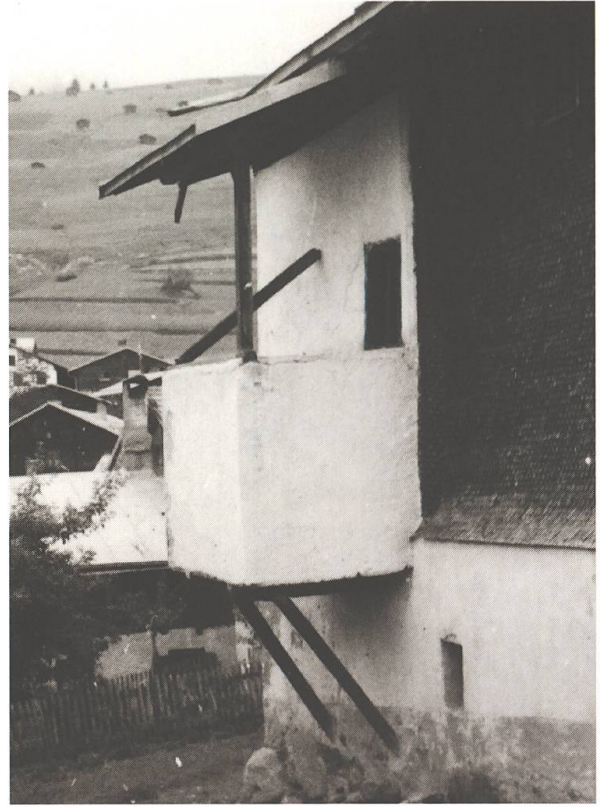
Fuorns mürads a Cinuos-chel e Falera (sura), Zernez e Tschlin (suot).