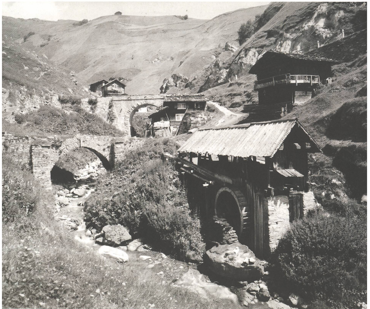
La Val da Mulin dadens Lumbrein (ca. 1915).