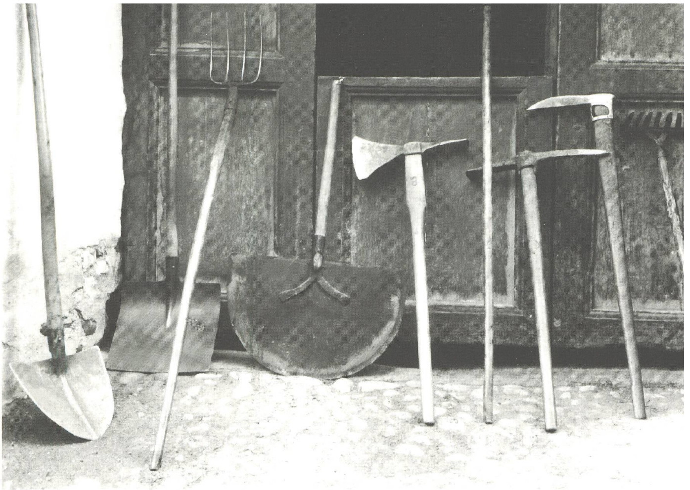
Badigl – pala da naiv – furtga da grascha – pala da sauar, che vegn chatschad' en per travers dal dutg per tegnair si l'aua – zappa d'uals u zappa da far dutgs: la part ch'è sco ina sigir serva per tagliar il tschispet – zappa da tartuffels – zappun – zappin – rastè da sternim (Zernez 1921).

Sauar era derasà en tut il Grischun, in dals documents ils pli vegls è en l'archiv da Tartar (Mantogna) ed è dal 1549. En in protocol da Trun dal 1703 èsi menziunà co decider, nua ch'i fiss da chavar l'ual da sauar: «Nua ch'ei podes vegnir schuau deigi da mintgin vegnir dau dutg in a lauter sil mender donn». Er la larghezza dals uals da sauar era prescritta, sco che nus pudain leger en in statut da Vaz dal 18avel tschientaner: «Iglis doitgs ner fossadas della ava â tgiesas deigien beigt esser pli lādâs tgê d'eing pêh lung».