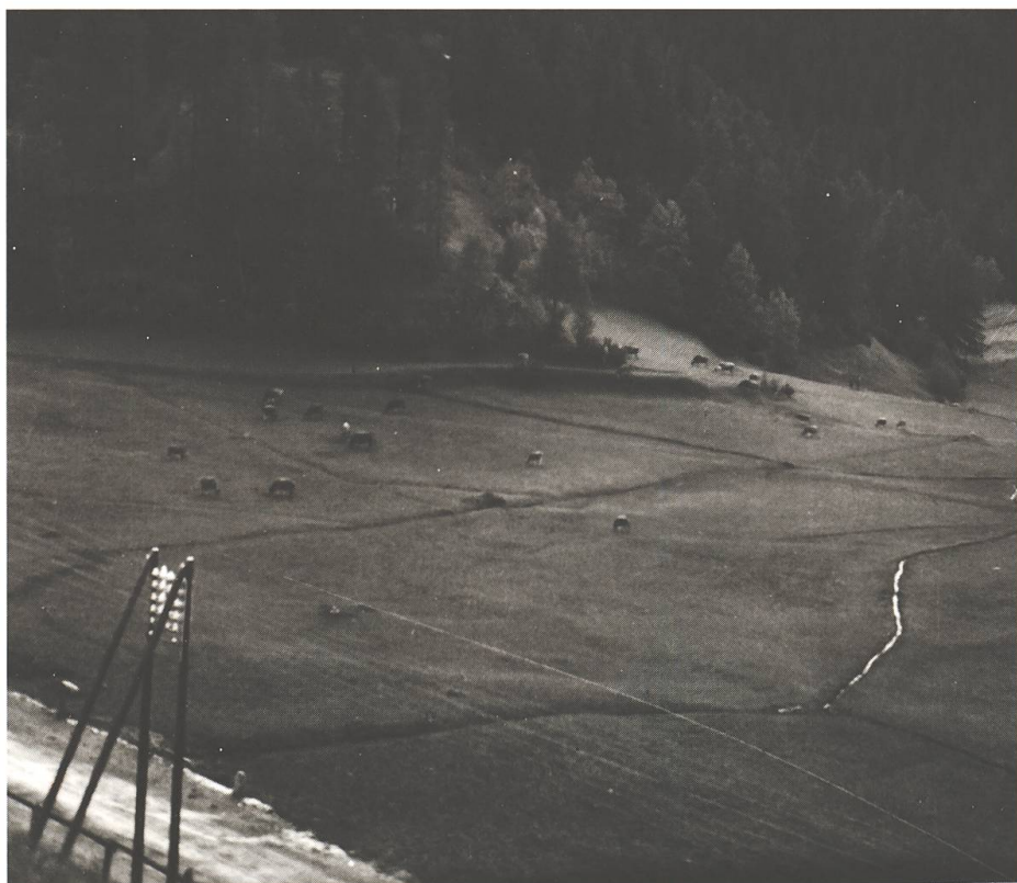
Prada cun ils uals da sauar ed il muvel a bual (sut la staziun da Guarda).

ir il fain davo ils auals». A Brail: «Chi chi saua d'avrigl, fa fain a giaschigl», ma: «Chi chi saua d'avuost, saua a seis cuost», perquai che per l'erva eri gia in pau tard. A Domat faschevani uschia: «I pi mender carstgon c'i vevan en cà tarmettevani cu i era da fierer si dutgs; cu i era dad ir a schuar tarmettevani bec i mender carstgon!».