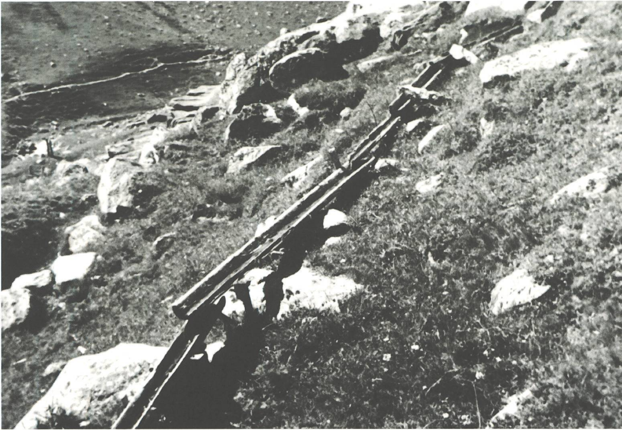
Chanals da lain mo plazzadas ina sur tschella, gnanc liadas ina cun l'otra (Valtgeva, Tujetsch).