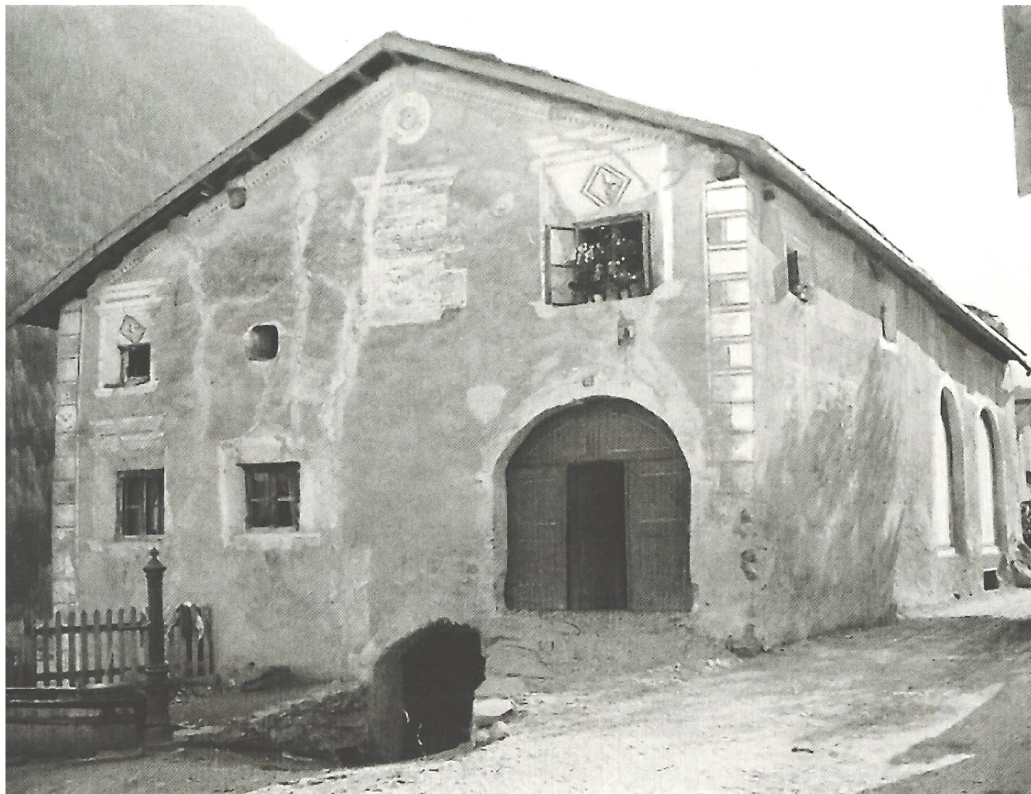
Ina casa engiadinesa a Lavin cun las duas entradas tipicas; davostier il clavau ( tablà ) (DRG 3, 409).

consequenzas: « Da plü bod d'eir'la (l'odur da grascha) adüna preschainta, ün'odur elementara » (Oscar Peer, La rumur dal flüm , p. 125). Tec a tec svanescha l'odur da grascha ord las casas ed ils vitgs. Ord nuegls e clavaus vits dat ei habitaziuns ... Sur la stiva e la cuschina, las sulettas stanzas scal-